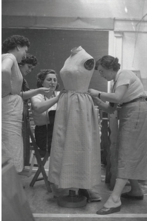
Figura 7. Las modistas españolas trabajan en un traje