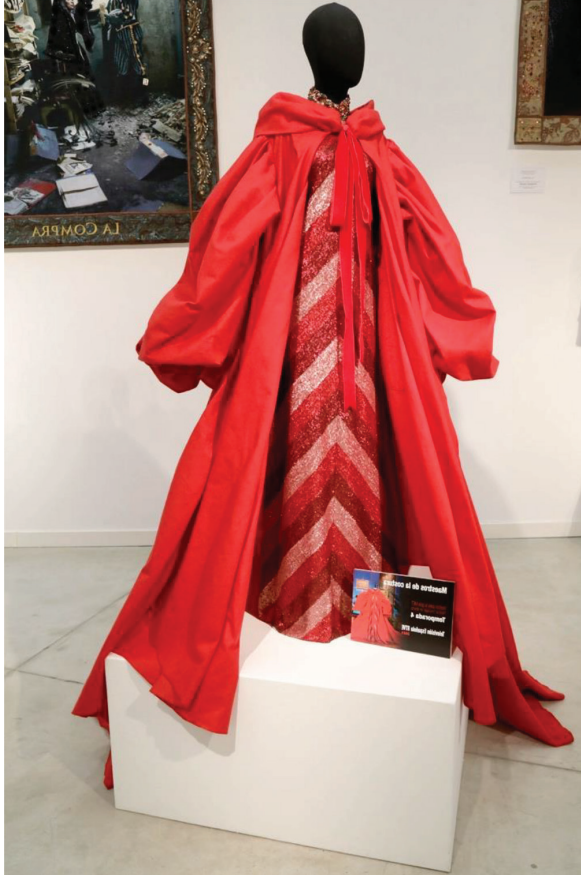
Figura 5. Traje elaborado en Maestros de la Costura