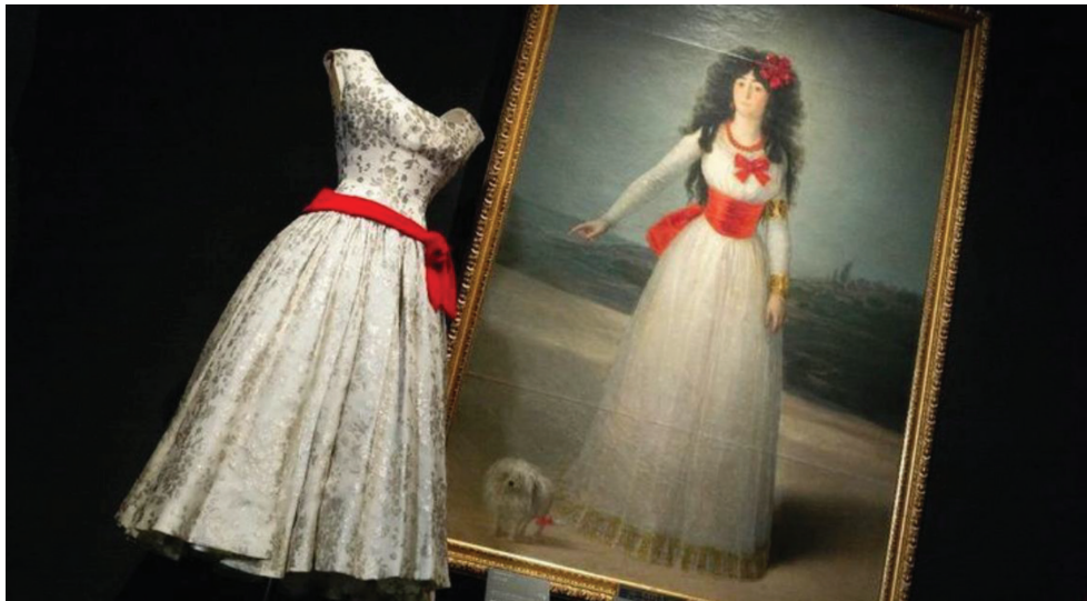
Figura 3. Balenciaga y la pintura española