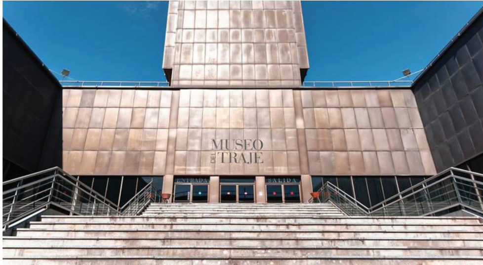
Figura 2. El Museo del Traje, fundado en 2004.