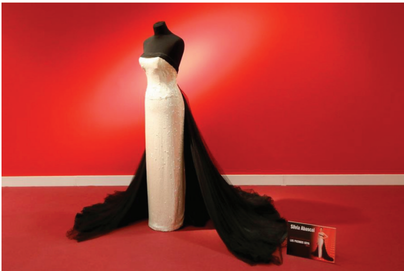
Figura 4. Traje de Silvia Abascal en los Premios Goya 2011

de Teatro Clásico, el Centro Dramático Nacional o el Teatro de La Abadía. La exhibición incluyó también el traje de boda utilizado en la película El lobo de Wall Street (2013), el vestido que usó Penélope Cruz en Manolete (2008), el traje de novia que llevó Clara Lago en el filme Ocho apellidos vascos (2014), así como algunos trajes utilizados por la cantante Marta Sánchez en sus múltiples giras y un par de vestidos lucidos por Anne Igartiburu en las galas televisivas con motivo de la nochevieja.