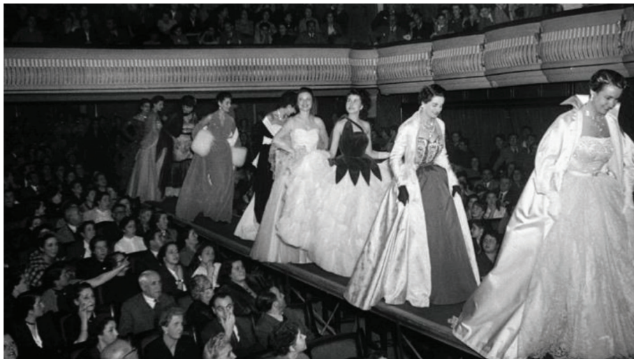
Figura 6. Desfile de moda organizado con motivo de la festividad de Santa Lucía