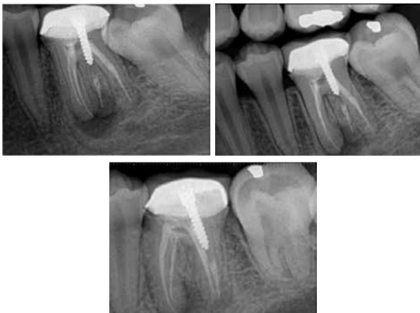
Figura 2. Radiografías Iniciales con diferentes angulaciones. Observe la presencia nítida del radix entomolaris.

A pesar de que se le insistió al paciente que sería necesario remover la corona, el mismo se negó y luego de firmar el consentimiento informado se procedió a iniciar el tratamiento. Inicialmente se realizó el aislamiento absoluto y la apertura endodóntica hasta confirmar la presencia de los