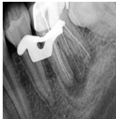
Figura 3. Radiografía de Longitud de los conductos radiculares.