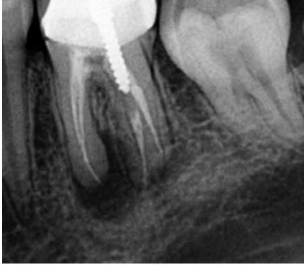
Figura 1. Radiografía Inicial.

diagnostica la presencia de Radix Entomolaris. (Figura 2). En la raíz disto lingual se observa la presencia de un endoposte metálico tipo "rosca". El diagnostico fue Tratamiento Previo, el diagnostico periapical fue Periodontitis Apical Aguda y el tratamiento indicado fue el Re-Tratamiento de los Conductos Radiculares.