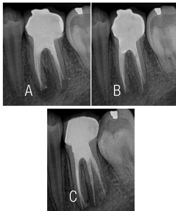
Figura 5. A. Radiografía final. B y C. Control post-operatorio. Observe el reparo óseo periapical.