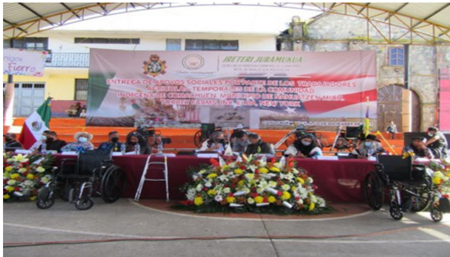
Figura 1. Entrega de sillas de ruedas, bastones, muletas y andaderas