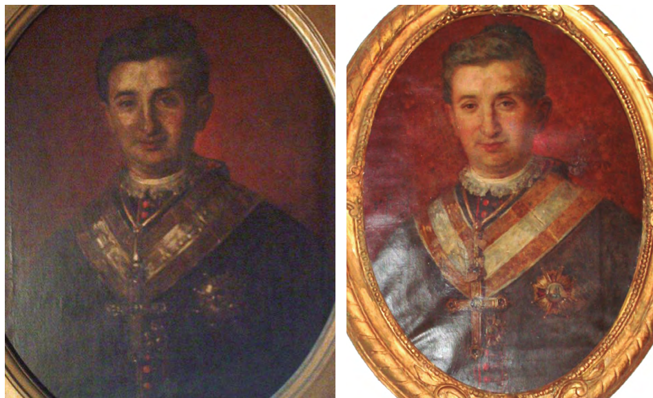
Figs. 10-11: comparación de ambos retratos.

La luz en el retrato de Mondoñedo es más plana y cae uniformemente sobre la figura, valorando todas las partes por igual, sin crear efecto de claroscuro. Es una luz uniforme. Tampoco crea tras la figura ese resplandor evanescente que sirve para destacar la cabeza, y que nos está indicando que la imagen, probablemente, esté inspirada en una fotografía , pues, esa luz difusa de fondo es, en muchos casos, un reflejo de la iluminación de los estudios fotográficos.