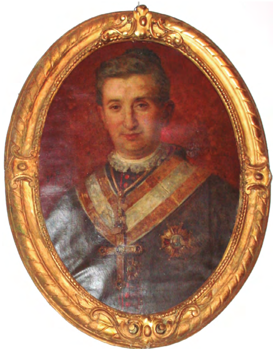
Fig 6: Retrato del obispo D. José María de Cos y Macho. Dionisio Fierros. Óleo sobre lienzo. 72x55,5cm. 1886. Catedral de Mondoñedo.

El cuadro está firmado en su lado izquierdo, y en el derecho puede leerse una inscripción en letras doradas: