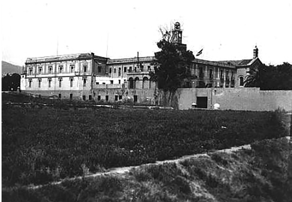
Fig. 4. Prisión de Les Corts.

tanto, era una prisión recién remodelada. Cuando las tropas sublevadas tomaron la ciudad, en 1939, la cárcel pasó a manos de las monjas de la orden de la Hija de la Caridad de San Vicente de Paul.