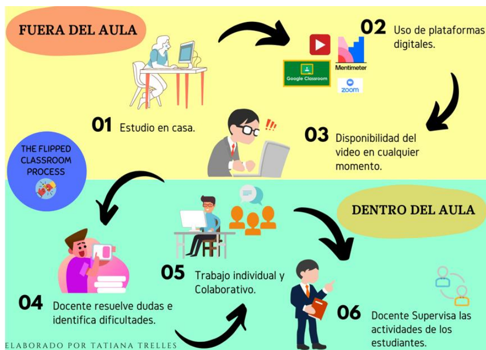
Figura 1. Aplicación del Flipped Classroom en la dsignatura de Ingles

de programas y herramientas digitales, de tal manera que se optimice el tiempo durante la clase y facilite la repetición de los videos a los estudiantes para poder realizar las actividades asignadas. Como se muestra en la Figura 1, los procesos como medidas para la aplicación en la la unidad educativa se propone lo siguiente.