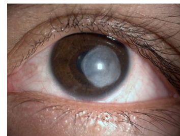
Figura 3: Paciente de 28 años, sexo masculino, usuario de LCB, que presentó un cuadro de queratitis por Acanthamoeba de evolución tardía. Se observa un leucoma denso que ocupa casi toda la cornea central postratamiento.

La mediana de la agudeza visual postratamiento fue mejor en los casos tratados de manera precoz (20/40), que la tardía (20/400) (Fig. 3), siendo la diferencia estadísticamente significativa ( p=0,0125 ). La mediana de la duración de la terapia en los casos precoces fue de seis meses, y en los casos tardíos fue de diez meses, esta diferencia también fue estadísticamente significativa ( p=0,0045 ). Todo lo anterior demuestra que la QA plantea un gran desafío para el manejo clínico. Si se le diagnostica precozmente, no sólo existe el potencial para una mejor recuperación de visual, sino también será necesaria una terapia más corta. Por eso, para asegurar un buen resultado, es esencial un diagnóstico rápido y precoz. Si la terapia se retarda más de tres a cuatro semanas el pronóstico se deteriora.