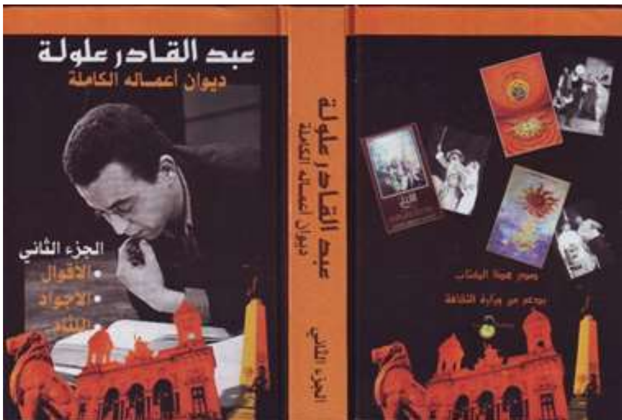
Imagen 1. Portada de la trilogía de Abdelkader Alloula, que incluye Al-Agoual , Al-Ajouad y Al-Litham , tomo II.

Nuestro objetivo al vocalizar los textos de la trilogía de Alloula escritos en árabe argelino, no únicamente ha sido para facilitar su lectura a los no argelinos, sino también a los propios argelinos, no acostumbrados a leer su propia lengua por no estar codificada, tal y como venimos refiriendo.