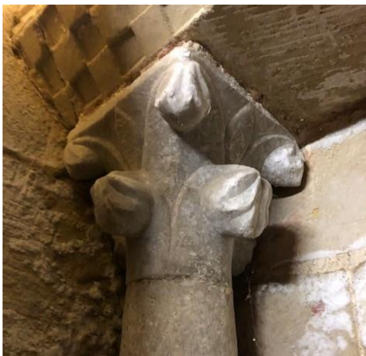
Capitell de l'arcosoli de l'esquerra, oratori del Temple, Palma.