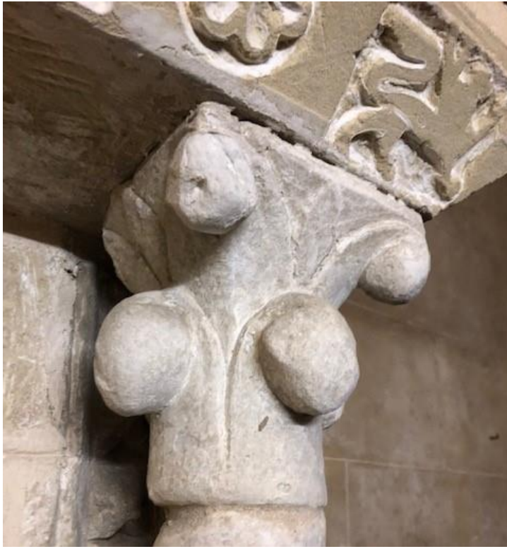
Capitell de l'arcosoli de la dreta, oratori del Temple, Palma.