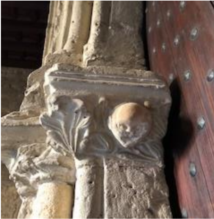
Detall del portal d'entrada, oratori del Temple, Palma.