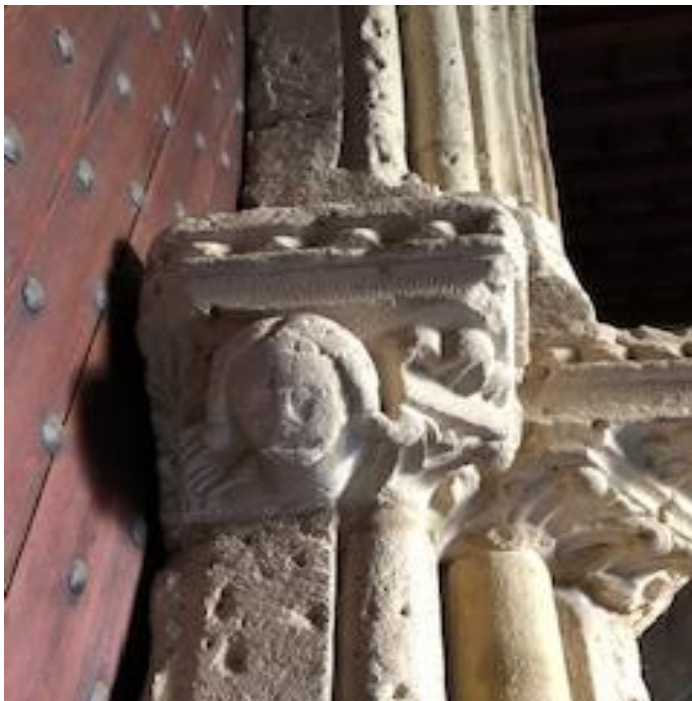
Detall del portal d'entrada, oratori del Temple, Palma.