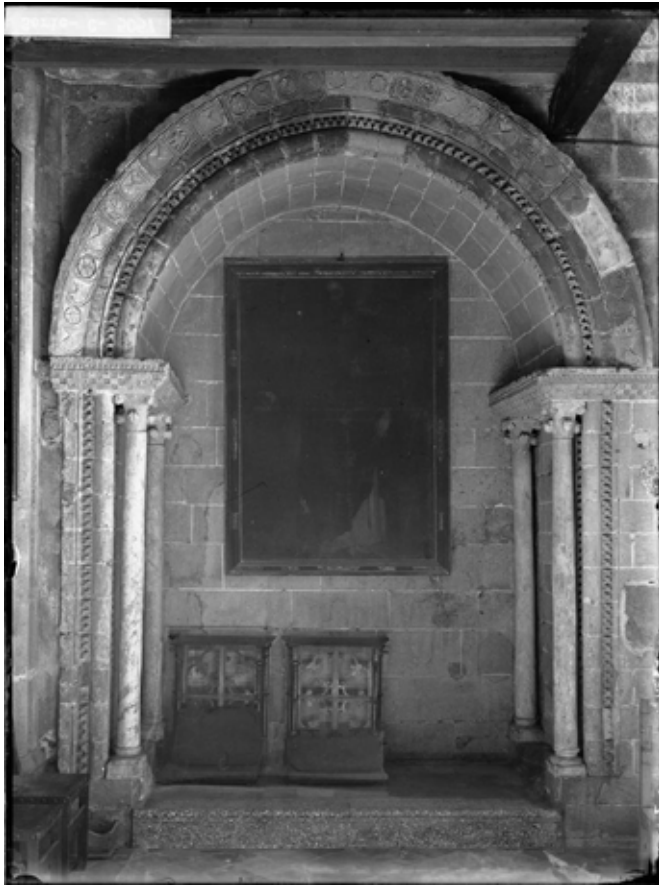
Arcosoli del costat de l'evangeli, oratori del Temple, Palma.

A l'entorn de l'oratori del temple, Palma: reflexions, capitells i altres elements.