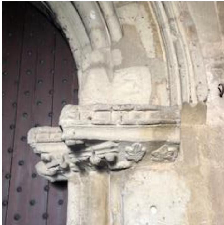
Detall del portal d'entrada, oratori del Temple, Palma.