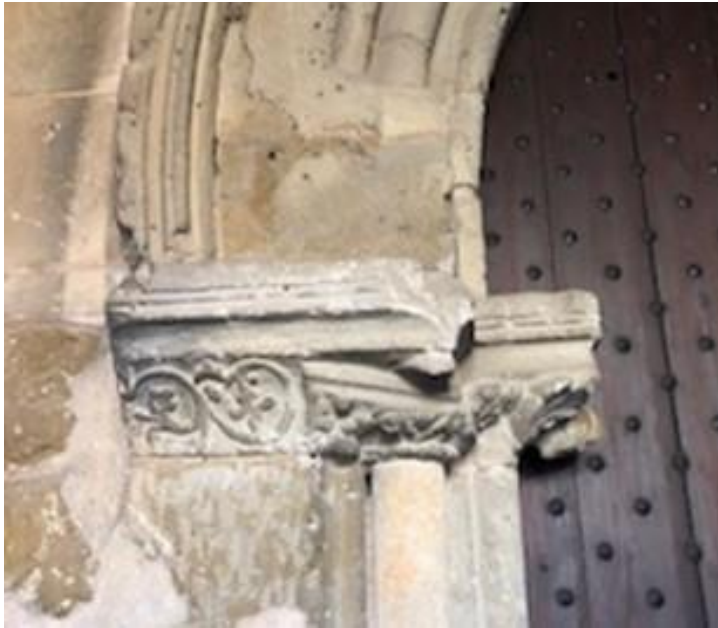
Detall del portal d'entrada, oratori del Temple, Palma.

A l'entorn de l'oratori del temple, Palma: reflexions, capitells i altres elements.