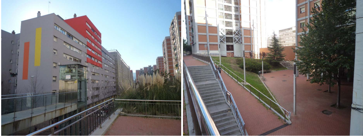
Figura 2. Rehabilitación de un bloque de viviendas y ascensor como ejemplo de mejora de la accesibilidad.