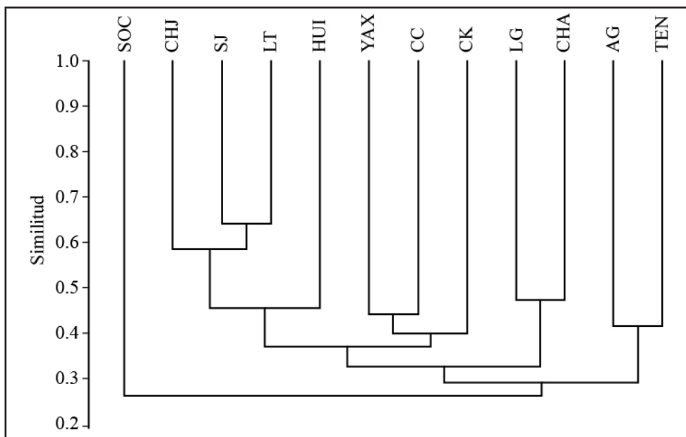
FIGURA 3 Relaciones de área con base en el algoritmo de similitud de Jaccard

Por otra parte, este análisis refleja las relaciones fenéticas entre las unidades geográficas (figura 3). Como resultado, presenta un arreglo diferente de las unidades geográficas; sin embargo, el grupo constante entre ambos algoritmos, de parsimonia y de similitud, es LG-CHA, y una rama que se asemeja al grupo CHJ–SJ–SLP–LT, aunque el arreglo topográfico es distinto HUI [CHJ (SJ, LT)]. Mientras, SOC sigue diferenciándose de las demás unidades y se corrobora la idea de que esta unidad geográfica es una isla biogeográfica en la vertiente del pacífico.