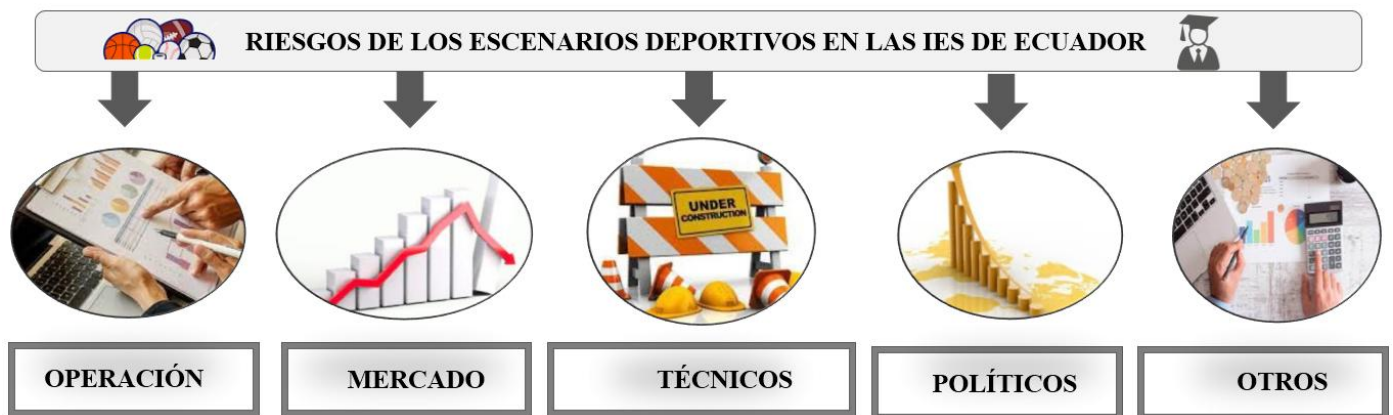
Figura 2. Clasificación de los riesgos de los escenarios deportivos en las IES de Ecuador.

La revisión de la literatura científica y el estudio exploratorio permitió la identificación de un conjunto de riesgos presentes en las infraestructuras deportivas de las IES en Ecuador. Los resultados tienen puntos de coincidencia con los hallazgos realizados en (Grimsey & Lewis, 2007), por lo que se asumió la clasificación de 5 tipos de riesgos, de los 9 propuestos por estos autores, tal como muestra la Figura 2: