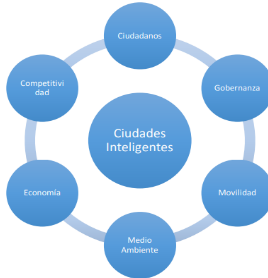
Figura 02. Servicios por considerar para la implementación de ciudades inteligentes.