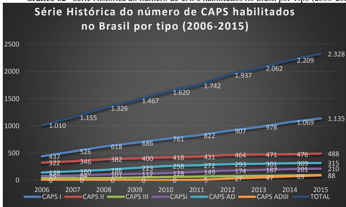
Gráfico 02 - Série Histórica do número de CAPS habilitados no Brasil por Tipo (2006-2015)

Visualizemos as informações em linhas no gráfico a seguir (Gráfico 2). A imagem mostra claramente, que o aumento do número dos CAPS se concentra predominantemente nos serviços do tipo CAPS I – que são serviços destinados a municípios menores (acima de 20.000 habitantes).