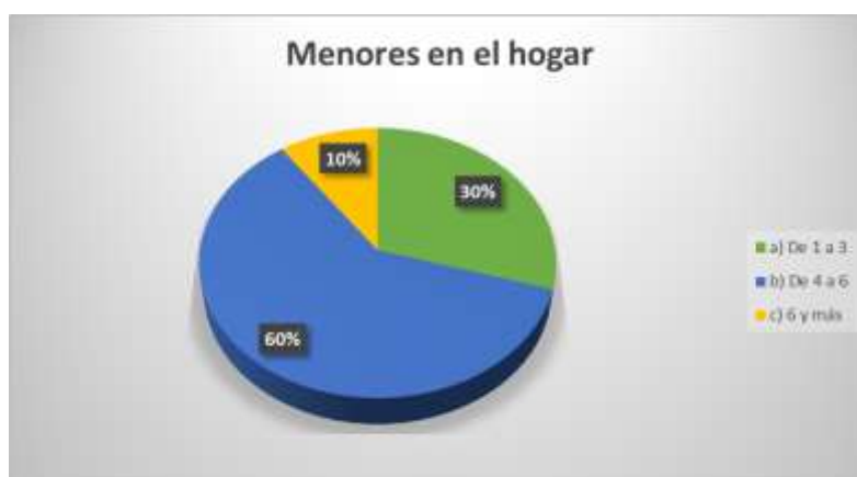
Figura 6. Menores en el hogar

Por otro lado, al preguntar el sexo de las personas de la cooperativa Sergio Toral 1, se pudo establecer que el 53% corresponde al género masculino, mientras que el 47% fueron mujeres.