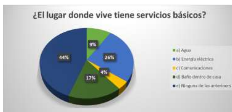
Figura 8. Acceso a servicios básicos

Según los resultados obtenidos, el 50% de los encuestados manifestaron tener un ingreso no mayor de $50, el 38% de los mismos dijeron que su ingreso se encontraba entre $51 y $100 mensuales, el 8% tienen un ingreso de $101 a $200 mensuales, y sólo el 4% dijeron tener un ingreso mensual superior a los $200.