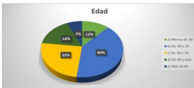
Figura 4. Edad

En esta investigación se tomaron datos de 152 personas, habitantes de la cooperativa Sergio Toral 1 de la ciudad de Guayaquil, en donde se pudo evidenciar la existencia de menores que trabajan, hogares que tienen el siguiente perfil: