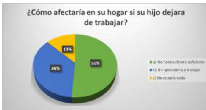
Figura 11. ¿Cómo afectaría en su hogar si su hijo dejara de trabajar?

En base a los datos de la figura 10, se puede decir entonces que la economía de estas familias se encuentra en condiciones precarias, lo que ha llevado a que los niños, niñas y adolescentes trabajen. Una vez que se preguntó quienes aportan económicamente en los hogares, el 60% de los encuestados mencionó que aportan padres e hijos, seguido por el 15% que dijeron que aportan solo los hijos, el 14% sólo padres y el 11% padres y familiares.