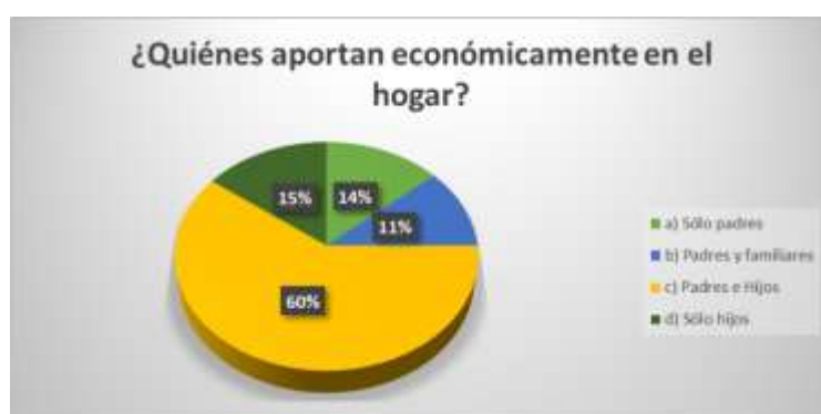
Figura 10. ¿Quiénes aportan económicamente al hogar?

Así mismo estas personas mencionaron que el 63% de los menores se desempeñan en actividades de ventas en la calle, el 23% de los menores realizan actividades relacionadas a la agricultura y el 14% laboran en actividades de servicios. Siendo lo más alarmante de esta situación que el 64% de estas personas mencionaron estar de acuerdo con que los menores trabajen, lo cual ha provocado una serie de consecuencias en los menores, entre las que se encuentra que más del 80% de ellos tengan enfermedades recurrentes, siendo la bronquitis y enfermedades respiratorias las más frecuentes, padeciendo el 58% de los niños esta enfermedad, seguido de enfermedades estomacales con el 17%.