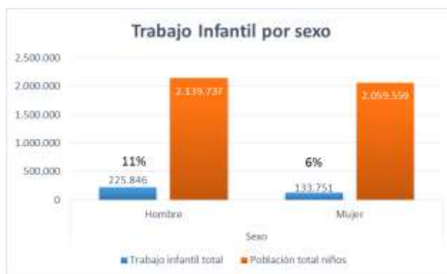
Figura 1. Trabajo Infantil Nacional por sexo

Fuente: Encuesta Nacional de trabajo infantil – ENTI 2012