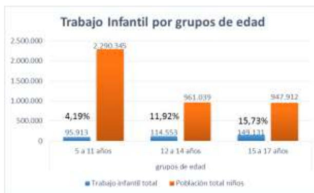
Figura 2. Trabajo Infantil por grupo de edades

En total existen más de dos millones de niños, de estos el 11% realizan actividades laborales, mientras que la población de niñas es de aproximadamente dos millones y medio de habitantes, de las cuales el 6% realiza actividades laborales.