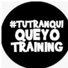
Figura 6 - Logotipo de "TuTranquiQueYoTraining"

De igual manera en la pestaña “ Nosotros ” se destaca la siguiente información: