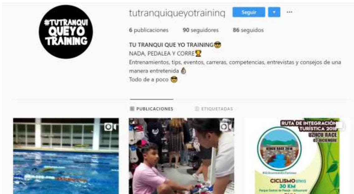
Figura 18 – Página de Instagram