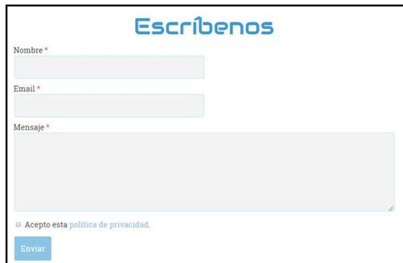
Figura 15 - Formulario de Contacto

En esta sección se presenta un formulario para que el visitante o usuario pueda contactarse con la empresa y resolver cualquier tipo de duda o realizar alguna sugerencia.