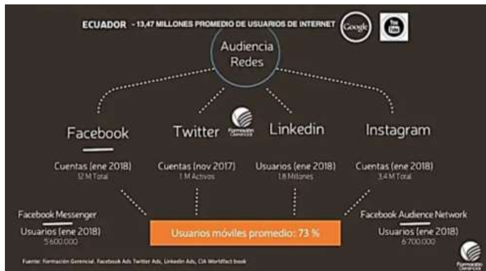
Figura 9 - Usuarios de Internet y Redes Sociales Ecuador abril 2018