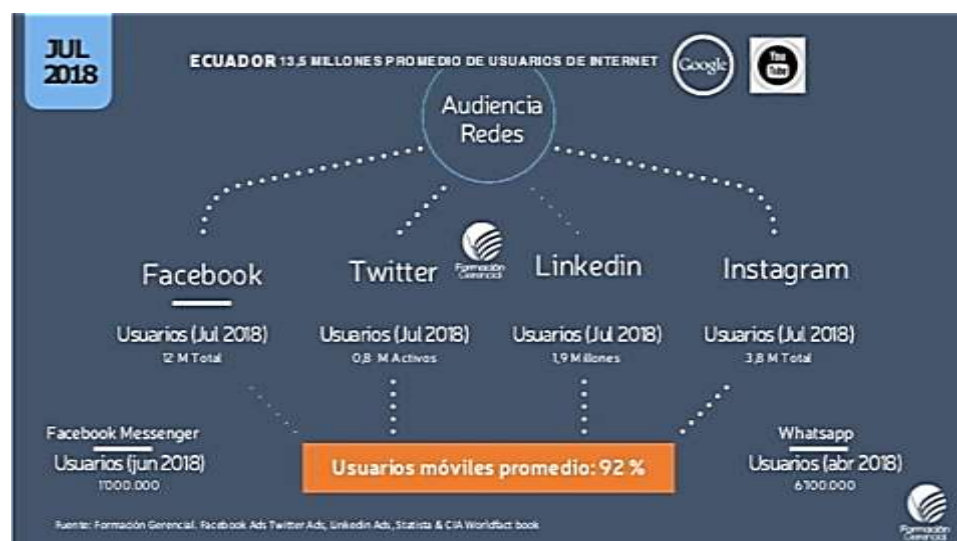
Figura 10 - Usuarios de Internet y Redes Sociales Ecuador julio 2018

Podemos observar como usuarios de Facebook con 12 millones e Instagram con 3,8 millones predominan como líderes de audiencia móvil en Ecuador, analizando la figura 9 y 10, se establece la incursión de WhatsApp con más de 6 millones de usuarios, cabe recalcar que estos datos son recientes y el incremento de utilización del smartphone con el 92% como promedio gracias a la fácil adquisición del mismo, y los bajos planes para acceder a internet.