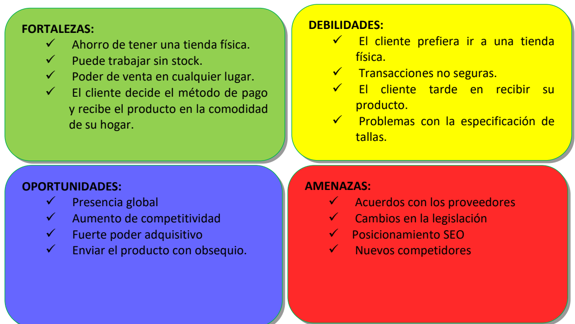
Figura 7 - FODA