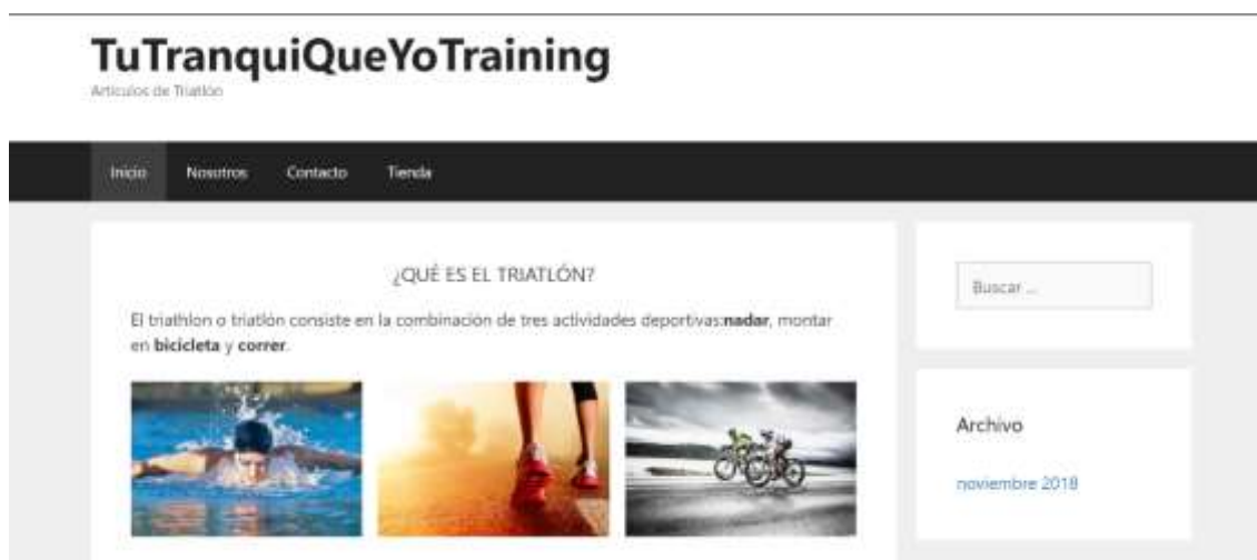
Figura 11 - Página Inicial Sitio Web

Se puede apreciar el logo oficial de la empresa, las pestañas de navegación, el slogan y una slider de imágenes que mostrarán fotografías acerca del deporte en mención.