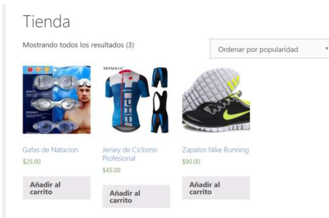
Figura 16 – Productos más populares (Tienda Online)

A continuación, se presenta el giro del negocio de “TuTranquiQueYoTraining” el cual es la exhibición de los productos para la venta online, se han plasmado tres artículos correspondientes a cada disciplina deportiva que conforma el triatlón, además de las principales redes en las que enfocaremos nuestra estrategia de marketing.