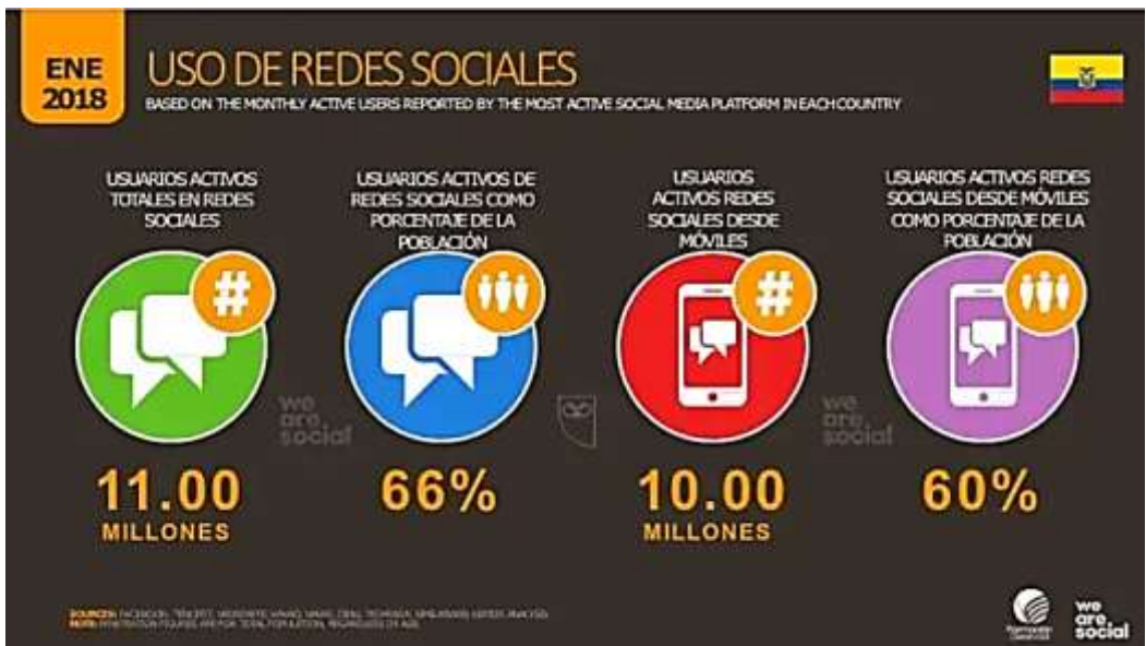
Figura 8 – Uso de redes sociales

TuTranquiQueYoTraining se encuentra ubicada en la ciudad de Machala, Provincia El Oro, Ecuador, a través del reporte especial de weare.social, podemos evidenciar el impacto de las redes sociales en el Ecuador.