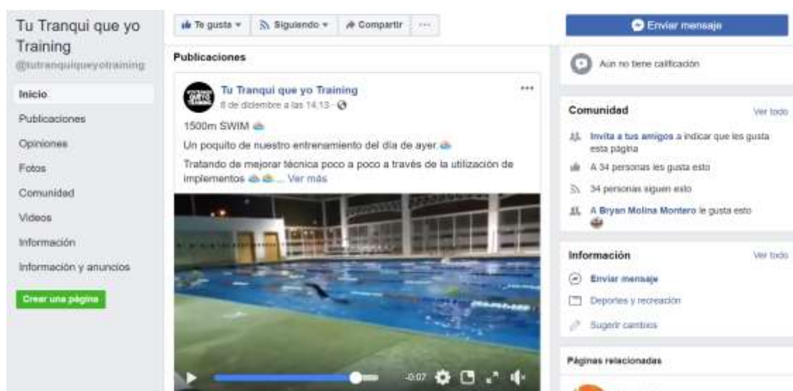
Figura 17 – Página de Facebook