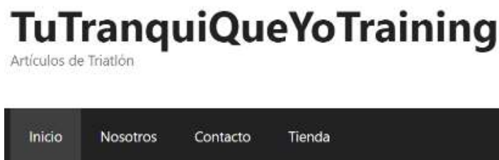
Figura 5 - Pestañas de Navegación de Sitio Web

El portal web de “TuTranquiQueYoTraining” se enfoca en un diseño limpio y minimalista basado en tendencias actuales que atrae la mirada del visitante, y consta de las siguientes pestañas: