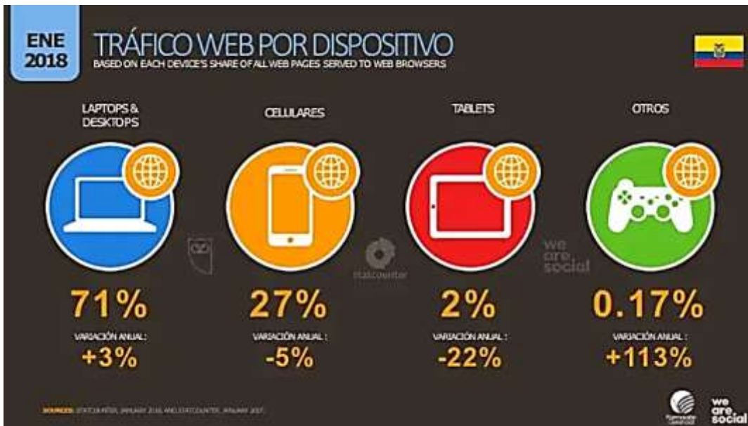
Figura 4 - Tráfico web por dispositivo

Un reciente reporte realizado por (weare.social, 2018), muestra un análisis de los usuarios de internet a nivel mundial y por primera vez muestra estadísticas de Ecuador. En la Figura 3 podemos observar la población total estimada en 16,74 millones, y los usuarios en internet de 13,47 millones dejando una clara referencia de que la mayor cantidad de ecuatorianos utiliza internet.