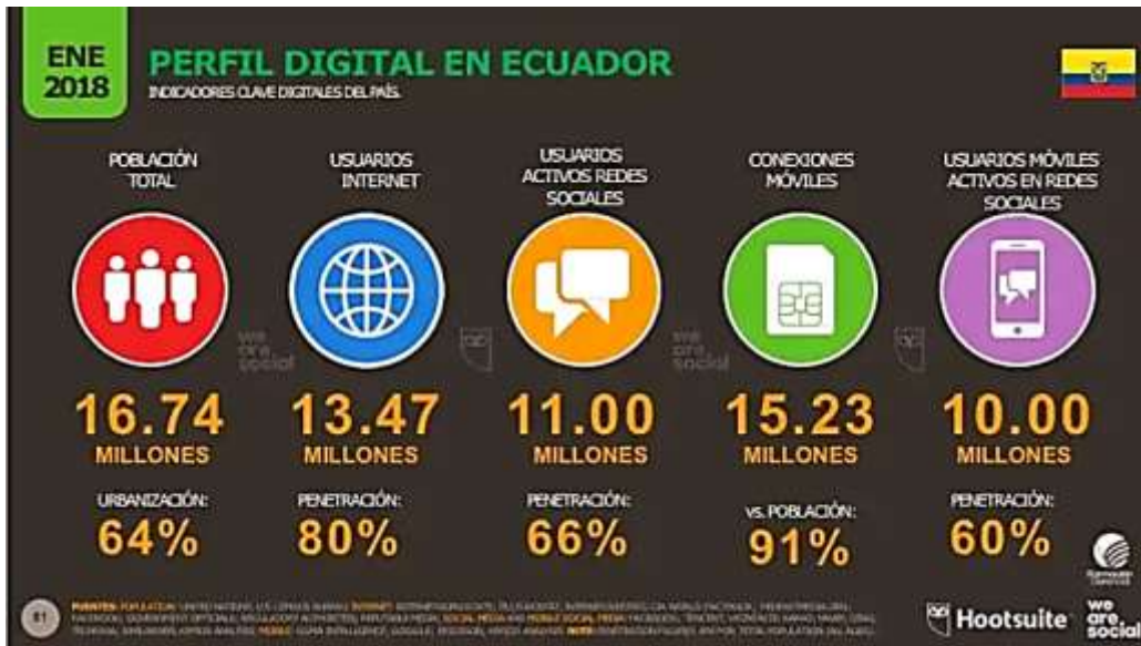
Figura 3 - Perfil digital en Ecuador