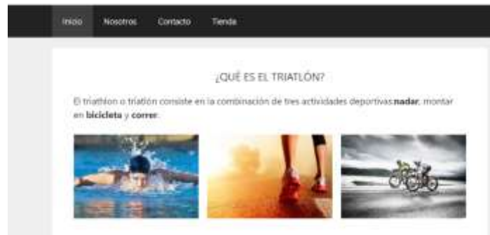
Figura 1 - Pestañas de Navegación de Sitio Web