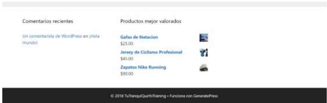
Figura 12 - Página Inicial Sitio Web