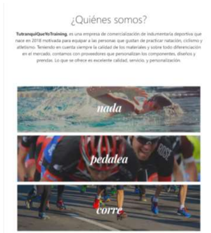
Figura 13 - ¿Quiénes somos? de " TuTranquiQueYoTraining "

En la pestaña denominada "Nosotros" se tendrá información acerca de la empresa con una imagen representativa, así como también la misión y visión de la organización.