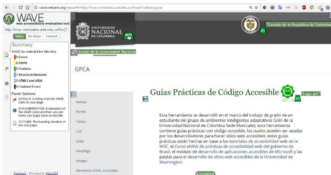
Figura 4. Evaluación de accesibilidad de GPCA usando el validador wave

En la primera etapa, aprovechando que se tenía planeado el desarrollo de la herramienta GPCA, su proceso de construcción se realizó siguiendo las guías propuestas. Al finalizar su implementación, la herramienta fue evaluada con tres validadores de accesibilidad diferentes, para determinar en qué nivel cumplía con características de accesibilidad.