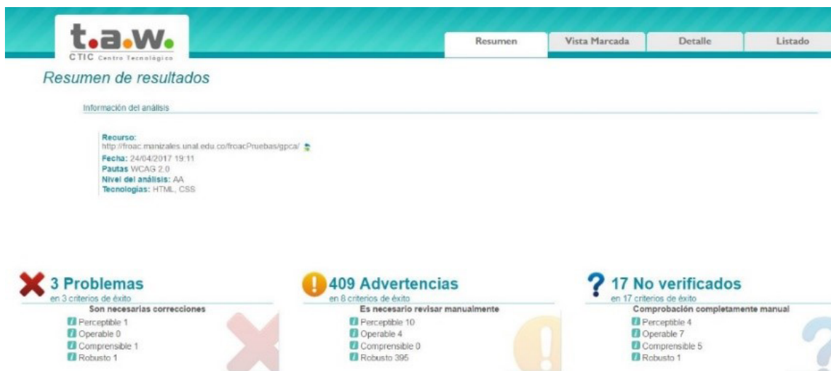
Figura 6. Evaluación de accesibilidad de GPCA usando el validador T.A.W.