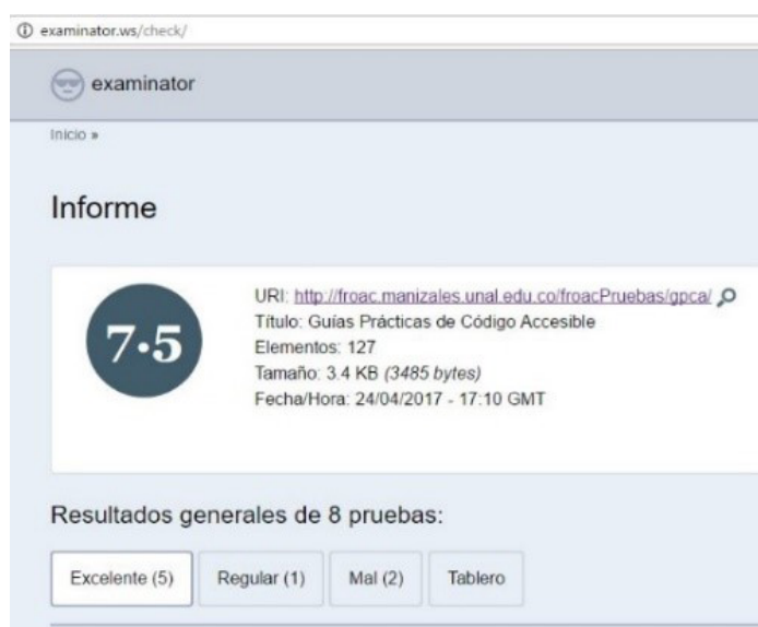
Figura 5. Evaluación de accesibilidad de GPCA usando el validador eXaminator

Como segunda etapa del proceso de validación de las guías prácticas de código accesible propuestas, en el trabajo de Montes, Londoño,