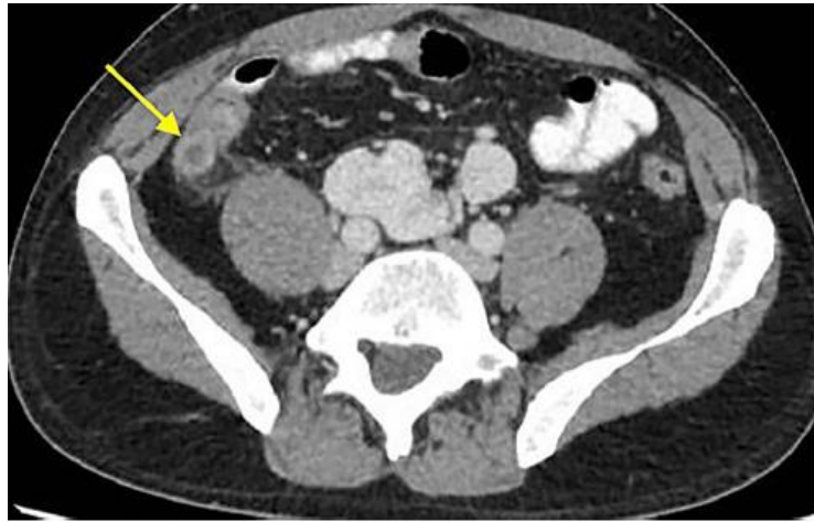
Figura 1. Tomografía axial computarizada de paciente con diagnóstico de apendicitis de muñón