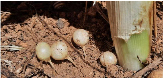
Figura 4. Bulbilos estipitados de A. cyrilli . Villargordo del Cabriel, Valencia, 09/06/2022. Autor 1.

De los datos expuestos, se puede prever a corto plazo en todos los núcleos visitados una rápida disminución de efectivos reproductores, la posible eliminación de poblaciones por cambios de uso del suelo (o precisamente por el uso recreativo de los mismos, aunque no se urbanicen) y la acción de predadores y la extinción total en un plazo de doce años (tres generaciones). Por la falta de datos sobre la evolución de las poblaciones de Castilla-La Mancha y Aragón, la posible existencia de núcleos no detectados en el área de extensión de presencia del taxón y por la posible reaparición de reproductores en los núcleos conocidos, la evaluación del estado de conservación en España sería DD (datos deficientes) al igual que a nivel europeo (Kell, 2011) o a lo sumo NT (casi amenazado). En efecto, se ha calculado una extensión de presencia en España de 59.800 km 2 , pudiendo estimarse en 55.000-60.000 km 2 , y existe un extenso hábitat potencial entre las localidades confirmadas. Por otro lado, el área de ocupación (AOO, Area of Occupancy) basada en una cuadrícula de 2 x 2 km es superior a 20 km 2 , exigido por el criterio D para la calificación EN, y al existir seis núcleos o subpoblaciones confirmados, se supera el umbral de 5 localidades y 20 km 2 para calificar una especie como VU (D2).