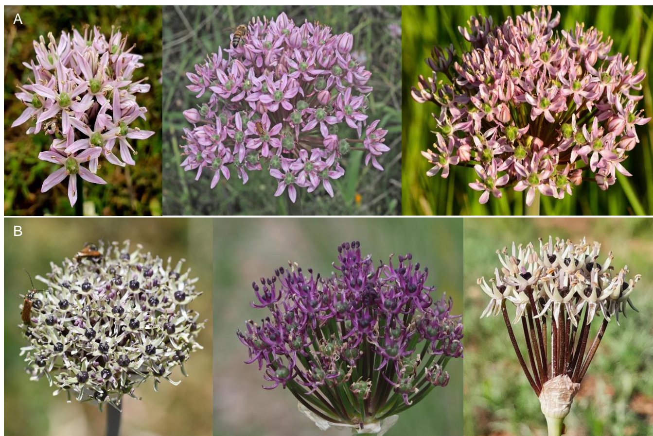
Figura 3. A: Allium nigrum . Izquierda: Orán, Tafraoui (DZA), Emilio Esteban-Infantes. Centro: Creta, Apesokari (GRC), © Felix Riegel - https://www.inaturalist.org/observations/25203100 . Derecha: Alcolea de Calatrava, Ciudad Real (ESP), Autor 3. B: Allium cyrilli . Izquierda: Creta, Omalós (GRC), © Fotis Samaritakis - https://www.inaturalist.org/observations/79147605 . Centro: Provincia de Savona, Liguria (ITA), © Luigi Bertero - https://www.inaturalist.org/observations/82159795 . Derecha: Jijona, Alicante, 27/05/2022, Autor 1 (fotos a diferente escala).

especies segetales que o bien se han enrarecido en los últimos años ( Roemeria hybrida (L) DC.) o presentan sus últimas poblaciones confirmadas recientemente en la zona (caso de Garidella nigellastrum L. en la zona de Cofrentes-Jalance, V). En las estaciones de Castilla-La Mancha y la Comunidad Valenciana los suelos son básicos, margoso-calizos o con horizontes superficiales ricos en arcillas, y el bio-ombroclima es pluviestacional-oceánico, termotipo mesomediterráneo superior y ombrotipo de subhúmedo inferior a seco inferior. La vegetación potencial corresponde a carrascales mesomediterráneos (www.globalbioclimatics.org, Rivas-Martínez, 1987).