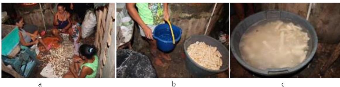
Figura 2 - Pelado y lavado de la yuca, proceso realizado por la señora Enna y sus dos ayudantes. 1a. Pelado de a yuca. 1b. Tobo de agua. 1c. Yuca en agua

En la Figura 1 se pueden apreciar los recipientes utilizados para el lavado de la yuca.