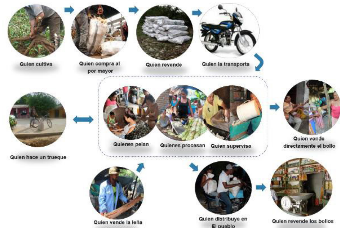
Figura 9 - Sistema de diversos oficios o prácticas artesanales asociadas a una sola de ellas