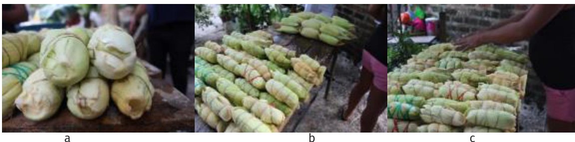
Figura 6 - Organización y conteo de bollos. 6a. Pila de 5 bollos. 6b. Línea de 4 pilas. 6c. Conteo de bollos.

Gabriela organiza los bollos en una forma particular de tal manera que pueda contarlos de 20 en 20 como se evidenció en el anterior pasaje, ver figura 6.