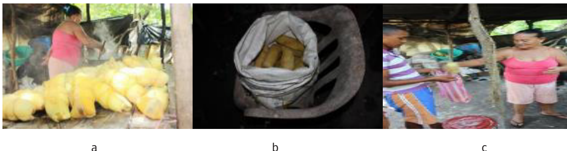
Figura 7 - 7a. Enna sacando los bollos. 7b. Bollos empacados. 7c. Venta de bollos en su residencia.

Enna va colocando los bollos en la olla una vez el agua esté caliente, va arrojando los bollos en pilas de 10 en 10 y luego tapa la olla para que esta hierva. El proceso de cocción de los bollos dura aproximadamente 2 horas. Ver figura 7.