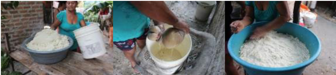
Figura 4 - Exprimida de la masa. 4a. Masa sin exprimir. 4b. Exprimiendo la masa. 4c. Masa exprimida.

En la Figura 4 se puede observar a Enna realizando el proceso de exprimir la masa.