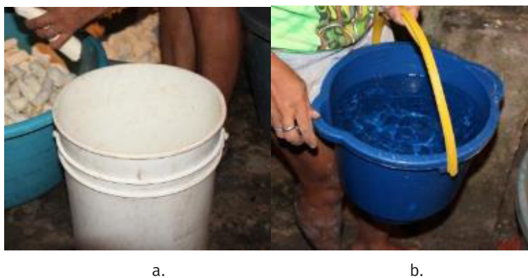
Figura 2 - Diferencia de tobos. 2a. Tobo para concha de yuca. 2b. Tobo para agua.

El tobo (balde) que se utiliza como medida del agua para lavar la yuca es distinto al tobo que utilizan para medir la cantidad de conchas de yuca como se muestra en la figura 2.