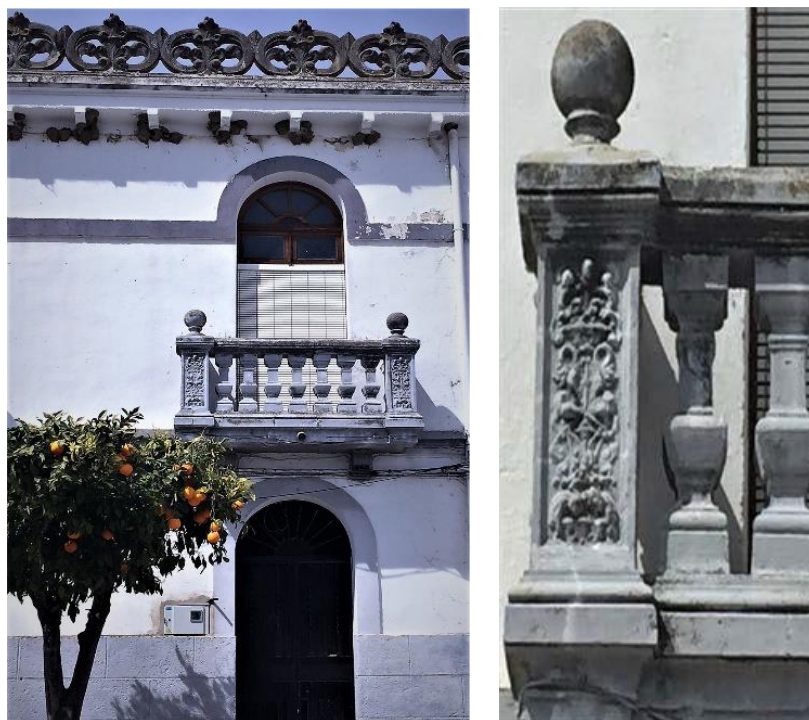
Detalle fachada y detalle balcón.