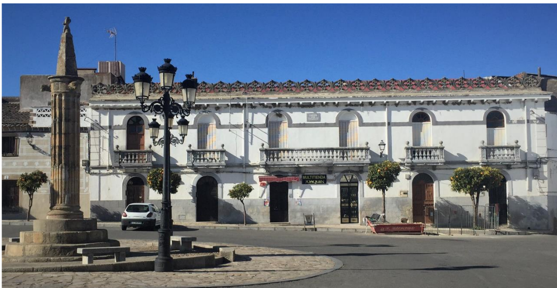
Vista de conjunto.

“...esta casa tenía 8 habitaciones y su fachada medía 25 metros, el corral era de un celemín de cabida , equivalente a 4 áreas 66 centiáreas. El corral tenía entra por detrás y lindaba por la derecha con Antonio Muriel Cadenas y por la izquierda con calle pública por la espalda con la Plaza 242 .”