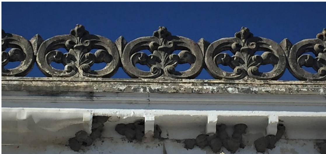
Detalle de la crestería.

de baile, la cual se transformó posteriormente en una discoteca en 1981. Dicha discoteca se usó también como salón de celebraciones hasta su clausura en el año 2005.