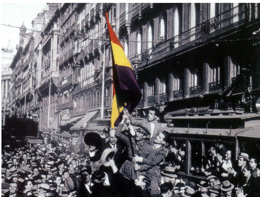
Manifestación republicana en Madrid el 14 de abril

El 14 de abril de 1931 se produjo uno de los hechos históricos más importantes de la España del siglo XX: la proclamación de la Segunda República Española, alegoría de los deseos de modernidad que pedía el país, tanto por las esperanzas que despertó como por las que malogró. Paradójicamente, el resultado de las elecciones municipales del 12 de abril de 1931 fue el detonante de este cambio histórico, que supuso la caída de la monarquía de Alfonso XIII y la victoria de una nueva experiencia republicana que ya había fracasado en su primer intento (1873-74). Además del cambio de régimen, a nivel local y nacional implicó el cambio de las viejas oligarquías, que retenían el poder, por nuevos grupos sociales y políticos que hasta el momento habían estado al margen de la política.