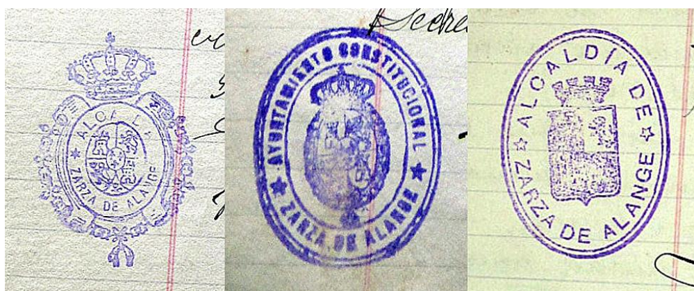
Sellos monárquicos y republicano utilizados por el Ayuntamiento de La Zarza

urbana, ambos cedidos por el Estado a los Ayuntamientos, autorizando al alcalde para que solicite el anticipo bajo las condiciones expuestas. Asimismo, se acuerda sondear al Ayuntamiento de Villagonzalo, interesado también en el camino, para que manifieste la aportación con la que va a contribuir para la construcción del mismo, y se da cuenta del oficio remitido por el teniente de la Guardia Civil de Guareña, sobre si el Ayuntamiento de La Zarza está dispuesto a facilitar el acuartelamiento adecuado con arreglo a las disposiciones vigentes para el puesto de la Guardia Civil que se tiene solicitado, así como el utensilio, menaje, documentación, asistencia médica y botica. El Ayuntamiento por unanimidad acuerda acceder a cuanto en dicho oficio le atañe.