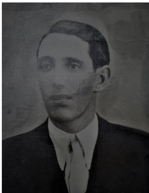
Valentín Guerrero Barragán, primer alcalde de la Segunda República

mesas electorales de cada colegio; el 5 de abril se proclamarán los candidatos, el 12 las elecciones y, por último, el 16 de abril se realizará el escrutinio general. Verificada por las Juntas de Escrutinio la proclamación de los concejales elegidos el día 16, previo sorteo realizado por esta misma Junta entre los candidatos empatados a votos, los presidentes enviarán relación de los proclamados a los alcaldes para que las hagan públicas en el tablón de anuncios de los ayuntamientos durante ocho días para conocimiento de los electores, por si procede realizar algún recurso de reclamación.