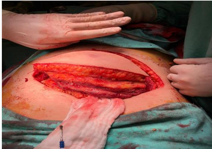
Figura 2. Fotografía de hemitórax izquierdo afectado

Posterior a la cirugía, 6 días después, se documenta por patología la presencia de bacterias ramificadas y cocoides negativo para neoplasia y compatible con A. israeli , por lo que se tuvo que tratar al paciente de manera ambulatoria por 12 meses con amoxicilina con clavulanato, con curación después de dicho tratamiento.