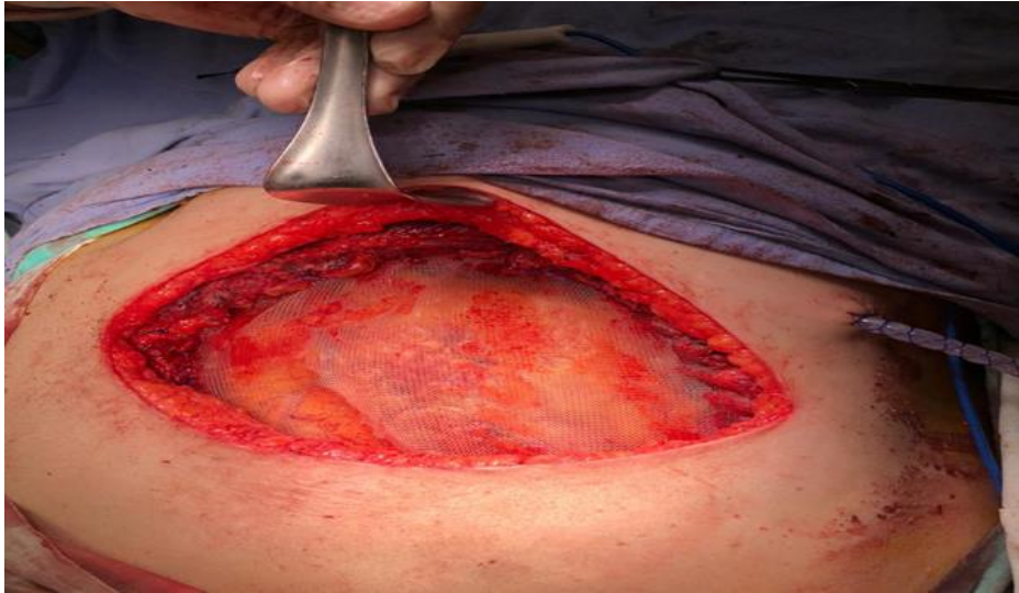
Figura 4. Fotografía de reconstrucción de defecto torácico con malla de Prolene doble cara