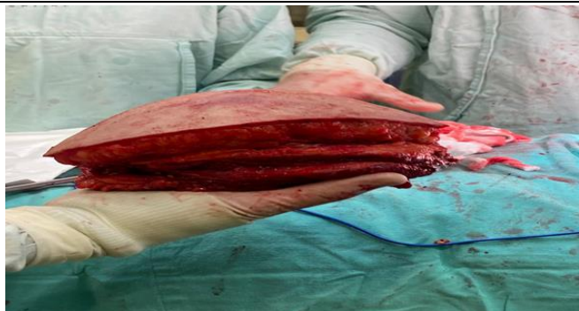
Figura 3. Fotografía de resección de arcos costales de C5 a C10 del hemitórax izquierdo