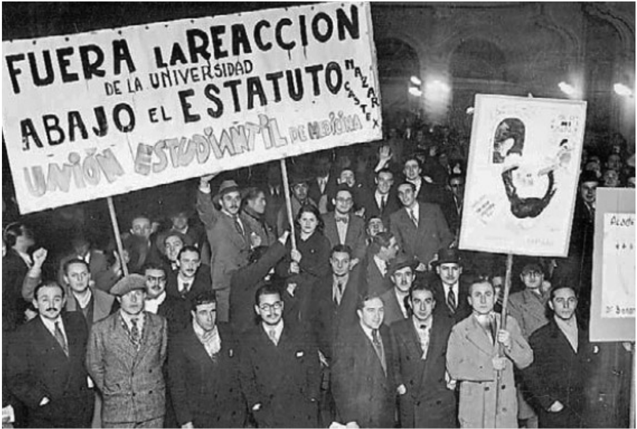
▪ Marcha de estudiantes de Medicina en Buenos Aires (Argentina), 1935

relaciones sociales en el seno del cual introduce un cierto número de efectos específicos. (Foucault, 2010, p. 106)