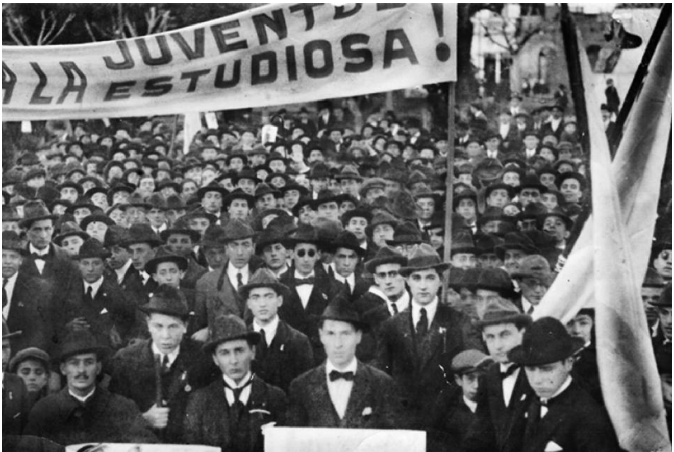
▪ Marcha del 10 de marzo de 1918, Córdoba (Argentina), 1918

procedimiento, tal como ocurre con los procesos de acreditación de las universidades en las que, puesto el andamiaje discursivo, lo que sigue es el procedimiento técnico de verificar el cumplimiento de sus demandas, tal como lo hacen los comités de acreditación y los pares académicos.