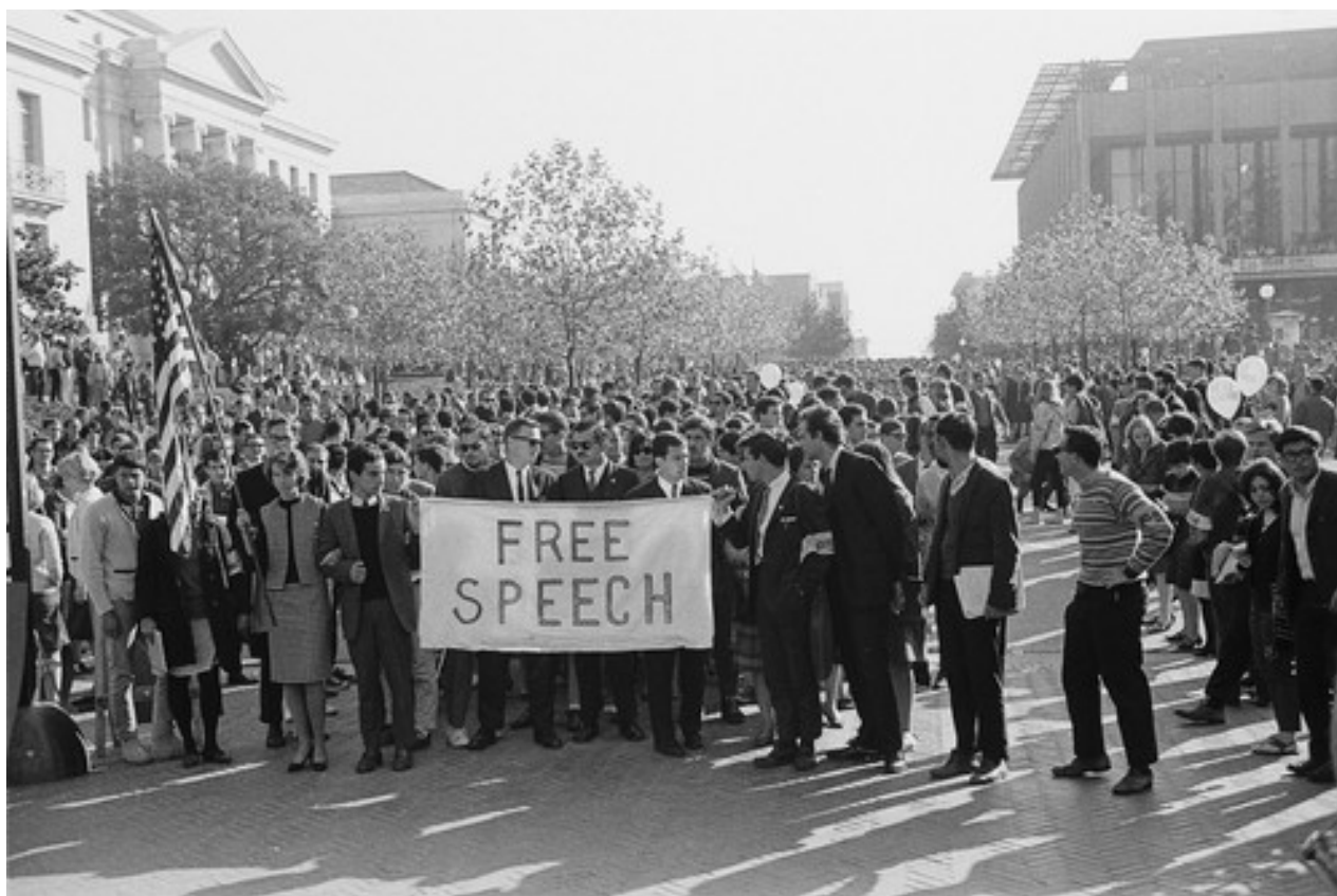
▪ Protestas de estudiantiles en Berkeley, California (Estados Unidos), noviembre de 1964

Diversos estudios críticos sobre los rankings universitarios (García y Pita, 2018; Barsky, 2014; Usher y Savino, 2006; Albornoz y Osorio, 2018) coinciden en señalar las debilidades en las metodologías y la falta de transparencia en los datos, los sesgos de medición por alta reputación histórica, tradición académica, lengua y territorio de origen de la firma evaluadora, así como la sobredeterminación de la productividad en investigación y publicaciones en revistas indexadas, en las que no tienen cabida las ciencias sociales y las humanidades o, cuando se las considera, se las mide con los mismos estándares de la producción tecnocientífica.