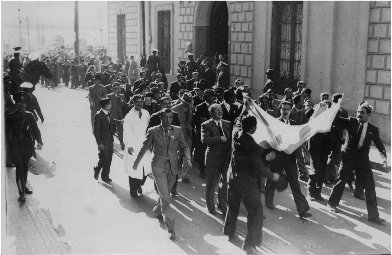
▪ Manifestación de estudiantes en la Ciudad de Córdoba (Argentina) en apoyo a la Reforma Universitaria, 1918

no solo un lenguaje característico, sino unas formas administrativas orientadas al logro de los intereses del mercado, de manera que la calidad educativa se mide por el crecimiento de la infraestructura (edificios, salas especializadas, oficinas de administración), homologación de la formación al crédito académico (creditización), internacionalización, número de patentes e investigaciones, revistas indexadas, bibliometrías que impacten el mercado y satisfagan la nueva “instauración” del saber cómo mercancía, en las que el lenguaje cumple dicha función de legitimación.