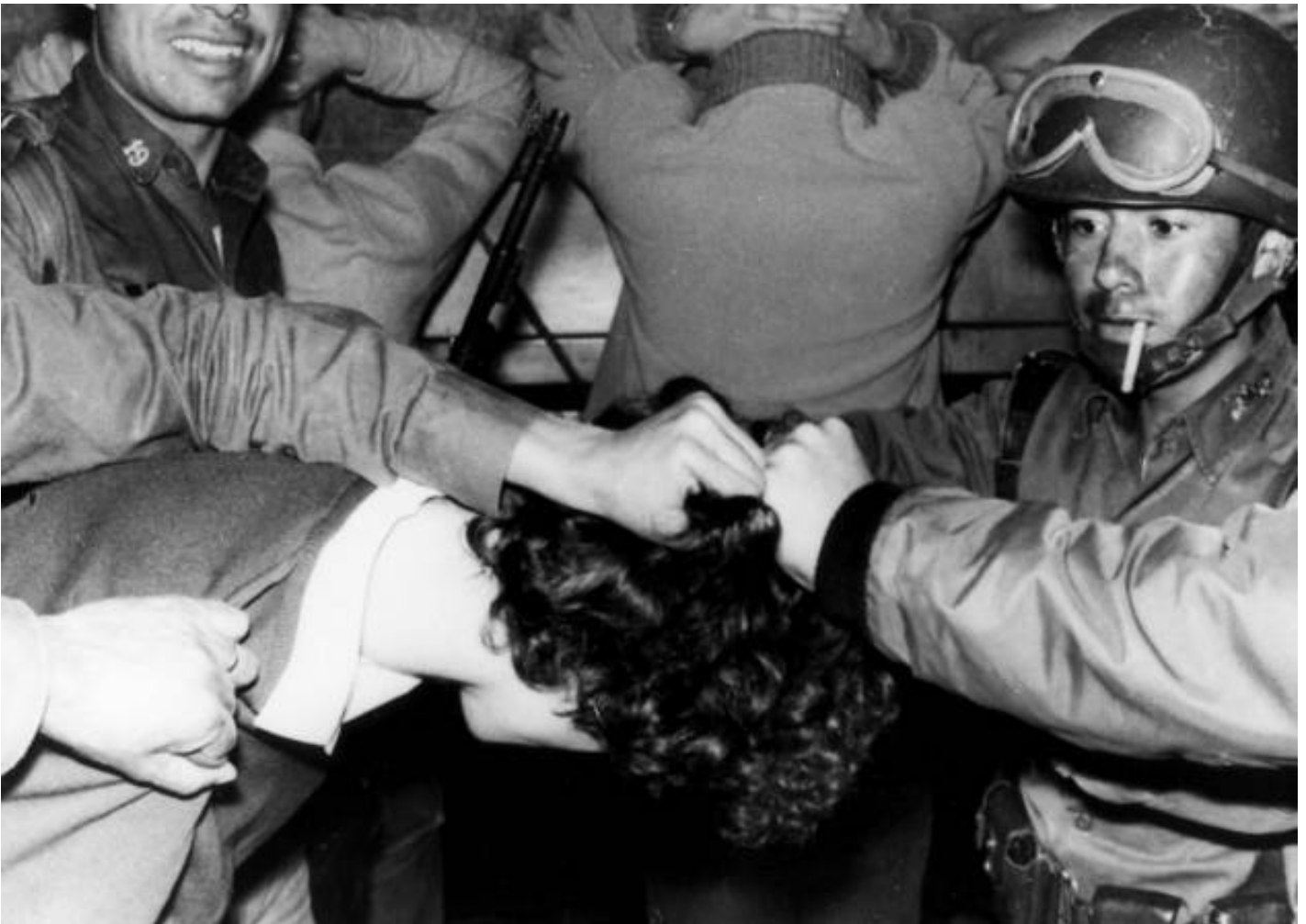
▪ Grupo de soldados detiene a un estudiante durante manifestaciones en Tlatelolco (México), el 2 de octubre de 1968

Los efectos performativos de la RC se desplazan de la vigilancia y el control empresarial a la vigilancia y el control de los sujetos. Para lograrlo trabajan en la materia blanda del cerebro, activando emociones extremas como el miedo al fracaso que activa la productividad, así como el narcisismo del éxito que la gratifica (sentimientos y emociones sobre los que se mueve en el plano subjetivo la RC), y que se expresan en la obsesión por la construcción de la imagen pública (la construcción de la marca personal) para