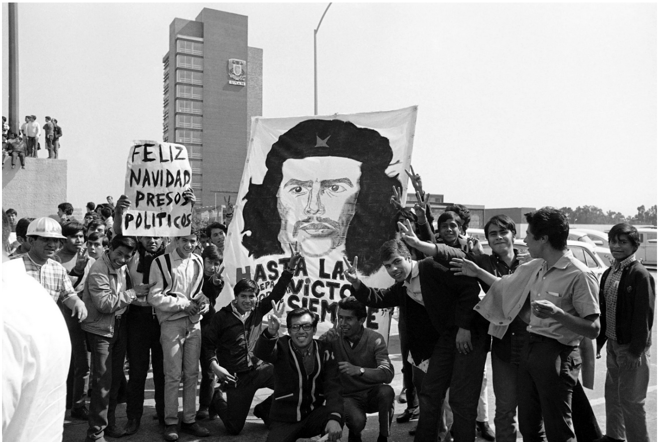
▪ Comunidad universitaria marchando en favor del partido comunista en México, c.a. 1958

cuales asegura su legitimación y la consecuente gubernamentalidad de los sujetos e instituciones educativas. Como dispositivos, puede considerarse que todos son de naturaleza discursiva, si se apela a la postura teórica de Angenot de considerar “discurso social a la totalidad de la significación cultural: [...] los monumentos, las imágenes, los objetos plásticos, los espectáculos” (2010, p. 47). De tal manera, tanto los discursos propiamente dichos como el conjunto de los artefactos que cumplen funciones de inculcación, tales como los objetos publicitarios, son discursivos en cuanto portadores de significación. Sin embargo, uno es el nivel discursivo cuando ocurre el acto ilocucionario de instauración del sentido como cuando, por ejemplo, una agencia discursiva: el Ministerio de Educación Nacional o la academia, producen un discurso de la profesionalidad docente, la calidad educativa, la rendición de cuentas y los ranking , y otro, cuando dicha instauración se organiza y refuerza por medio de las normas y los decretos que la reglamentan, o cuando