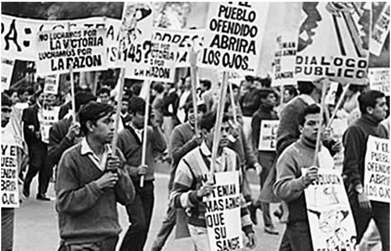
▪ Manifestación del movimiento estudiantil de Tlatelolco (México), 1968

origen' ( que ) al solidarizarla con cierto mercado, contribuye también a definir el valor de sus productos en los diferentes mercados" (Bourdieu, 1988, p. 63).