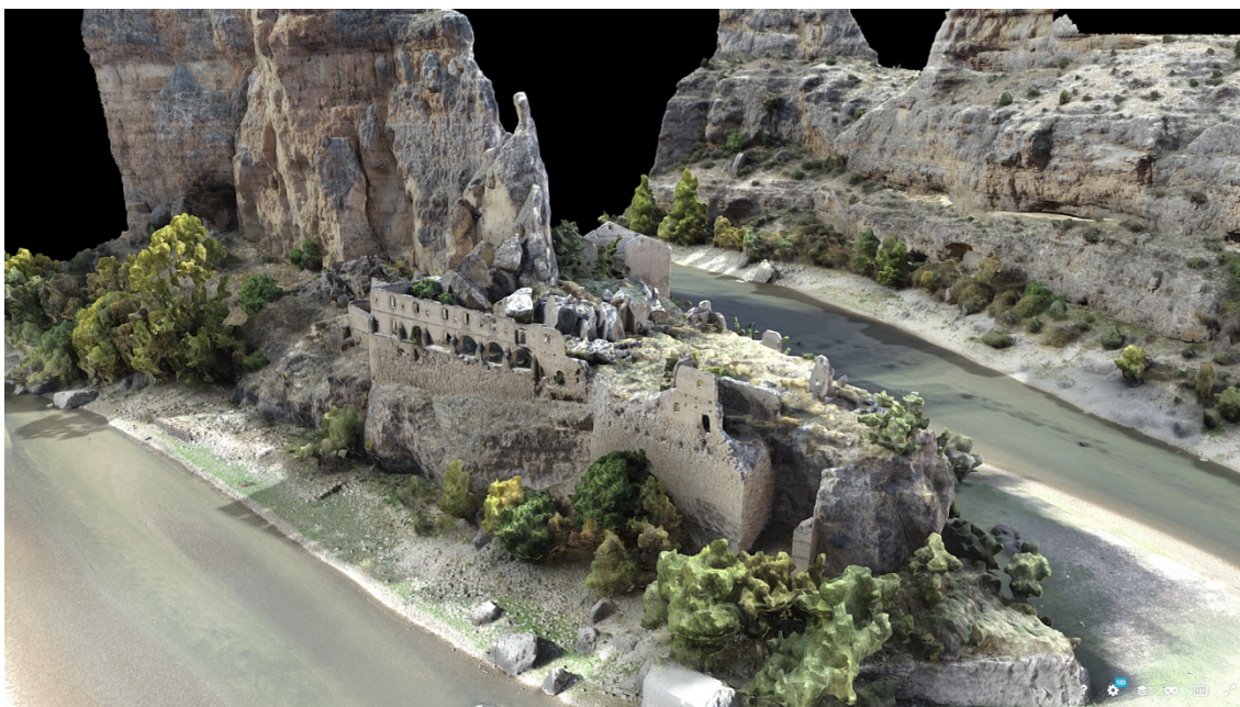
Fig. 5: Modelo 3D de las ruinas del convento de Convento de Nuestra Señora de los Ángeles de la Hoz. Global Digital Heritage (2019). Convent Nuestra Señora de los Ángeles de la Hoz. 3D Model. Sketchfab. https://sketchfab.com/3d-models/convent-nuestra-senora-de-los-angeles-de-la-hoz-a11087e5c8734d3482c9b9df8b206778

Perrino, especializado en documentación y digitalización del patrimonio. Las técnicas fotométricas y virtuales en 3D permiten reconstruir, para estos contextos de religiosidad interior, sus identidades de lugar practicado para la devoción medieval, aunque para ello sea pertinente recordar la necesidad de contextualización que tienen estas imágenes arquitectónicas. Unas, como lo son todas las medievales, que no pueden ser analizadas de forma aislada sin inscribirlas en el suelo que las fundamenta, conforme a la relación dinámica que mantienen los espacios con la sociedad que los produce y con los individuos que lo significan mediante un vínculo funcional y sensorial (Schmitt, 1999, p. 25).