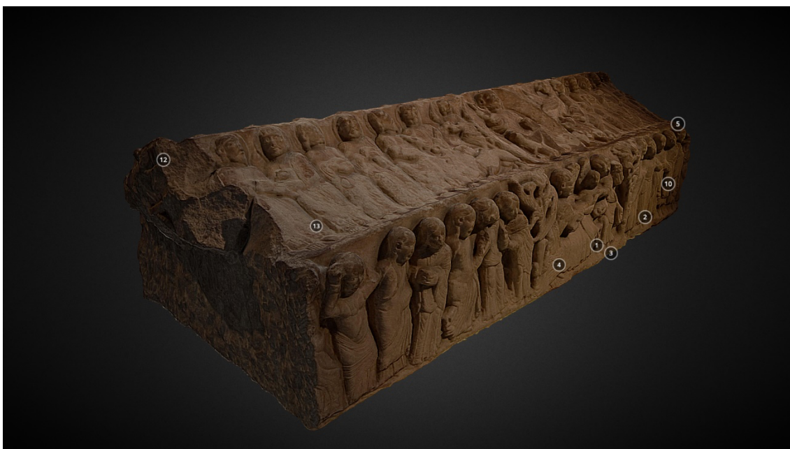
Fig. 6: Modelo 3D del sepulcro de Blanca de Navarra. Zoilo (2018). Sarcophagus lid of Blanca de Navarra . 3D Model. https://sketchfab.com/3d-models/sarcophagus-lid-of-blanca-de-navarra-8ec2d026b254422d9fa59262bcd514d7

La colección de diferentes estancias, imágenes y circunstancias escultóricas relativas a los monasterios pertenecientes a la red se encuentra disponible en el mencionado sitio Sketchfab . El patrimonio mueble y funerario del monasterio Real de san Benito de Sahagún o Santa María la Real de Nájera [Fig. 6] se presentan con una diversificación de usos que aspira a que los modelos de digitalización 3D sean planteados para su estudio o consulta científica «hasta labores de divulgación y difusión, pasando por restitución de volúmenes, restituciones virtuales o su inclusión en entornos de Realidad Virtual o Realidad Aumentada» (Perrino, 2021).