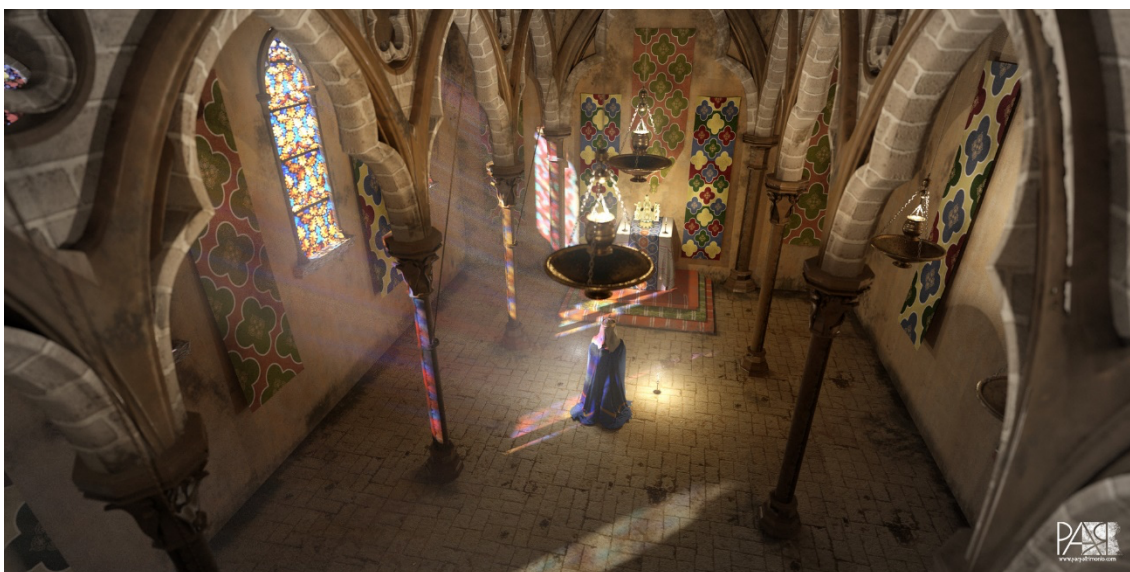
Fig. 2: Recreación en 3D del rezo de la Reina Violante de Aragón. 2018. Aparicio, P. (2018). Recreación en 3D del rezo de la Reina Violante de Aragón (siglo XIII). Patrimonio y tecnología .

Por tratarse el entorno coral toresano y la capilla palatina de realidades desaparecidas, con imágenes y objetos cuya materialidad se ha visto modificada por una serie de intervenciones posteriores a sus contextos medievales, en la actualidad se presentan despojados de su carga social, funcional y sensorial (Lahoz, 2021, p. 77). Con estas intervenciones se buscaría, en este sentido, emular la experiencia histórica de las religiosas medievales: «ver a través de sus ojos y los de sus contemporáneos» (Hamburger, 1997, p. 2) para reimaginar la potencia visual de los espacios. Convenga recordar, sin embargo, cómo para el estudio de las imágenes medievales conventuales «debemos olvidar cualquier noción preconcebida de 'arte' [...] (e) intentar habitar su palabra, alejada de la nuestra por el paso del tiempo y la reclusión de la clausura» (Hamburger, 1997, p. 2). Con ello, el trabajo realizado por PAR y por la universidad vallisoletana supone un interesante punto de partida a partir del cual desarrollar lecturas acordes a los usos y funciones que dan valores de lugar histórico a estos espacios de mujeres medievales planteados en las infografías.