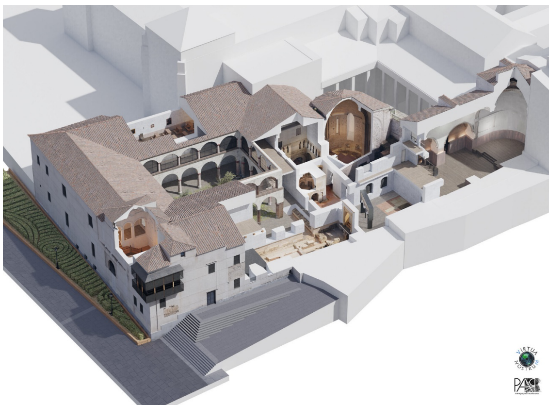
Fig. 3: Boceto-esquema de la recreación del convento de Santa Fe, Toledo, siglos XIII-XV. 2019. Aparicio, P. (2019). El conjunto monumental de Santa Fe de Toledo (III): la Capilla de Belén. Patrimonio y tecnología . https://parpatrimonioytecnologia.wordpress.com/2019/04/10/el-conjunto-monumental-de-santa-fe-de-toledo-iii-la-capilla-de-belen

facilitar la hoy extendida divulgación de las etapas formales de adecuación arquitectónica que experimentó el palacio califal original ante sus nuevos usos como hospedería de la orden de Calatrava, conservatorio en tiempos de Alfonso X y hogar de las religiosas de la Concepción franciscana, comendadoras de Santiago y compañía de santa Úrsula [Fig. 3]; se contó, para ello, con un equipo interdisciplinar asesorado por profesorado de Historia del Arte de la Universidad Complutense de Madrid, arqueólogas y restauradores. Se entiende así la periodización de un complejo conventual que, como es común en este tipo de arquitecturas, no es ajeno a las temporalidades de la obra artística pues su evolución se gesta de forma orgánica como planteamiento y respuesta de los contextos urbano-religiosos de su devenir histórico.