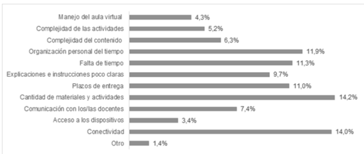
Figura 1. Dificultades en el proceso de aprendizaje en modalidad virtual