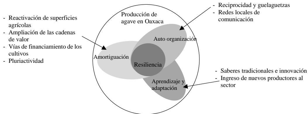
Figura 2. Modelo de resiliencia y sus componentes en el sistema de producción de agave.

Contrario a lo que podría esperarse, los resultados muestran que los productores están siendo resilientes frente al incremento en la demanda de agave. Esto parece asociarse con el desarrollo de los componentes básicos de la resiliencia (Figura 2).