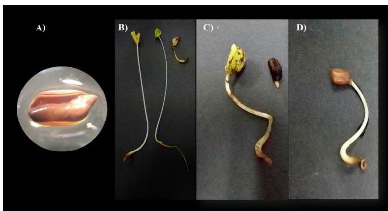
Figura 3. Semillas de Senna uniflora después de ser sometidas a distintas dosis de extractos etanólicos de M. brownei . A) semilla fenolizada, producto del tratamiento con extracto de hojas al 1%; B) plántulas derivadas del tratamiento con extracto de frutos al 1%; C) plántulas derivadas del tratamiento con extracto de frutos al 2.5%; y D) plántula fenolizada, derivada del tratamiento con extracto de corteza al 1%.

Finalmente, en la Figura 3 se presentan los efectos producidos por los extractos etanólicos de M. brownei en el desarrollo inicial de plántulas de Senna uniflora . En general, se observan puntos de necrosis en las hojas y tallo, clorosis e inhibición de la raíz.