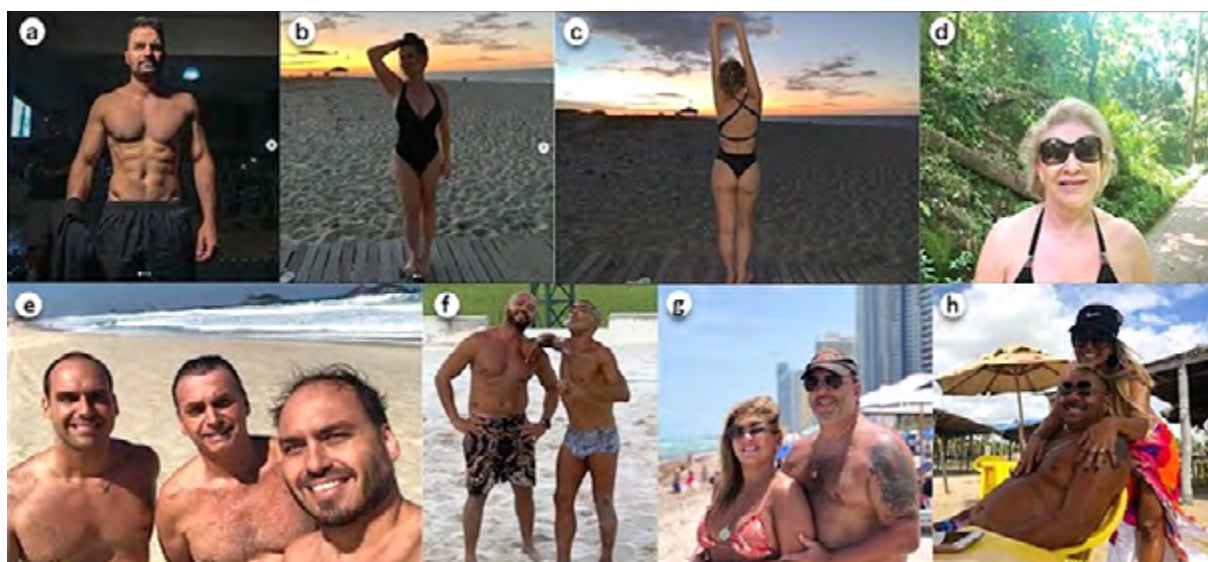
FIGURA 2 – FOTOMONTAGEM DAS IMAGENS ANALISADAS – CORPO