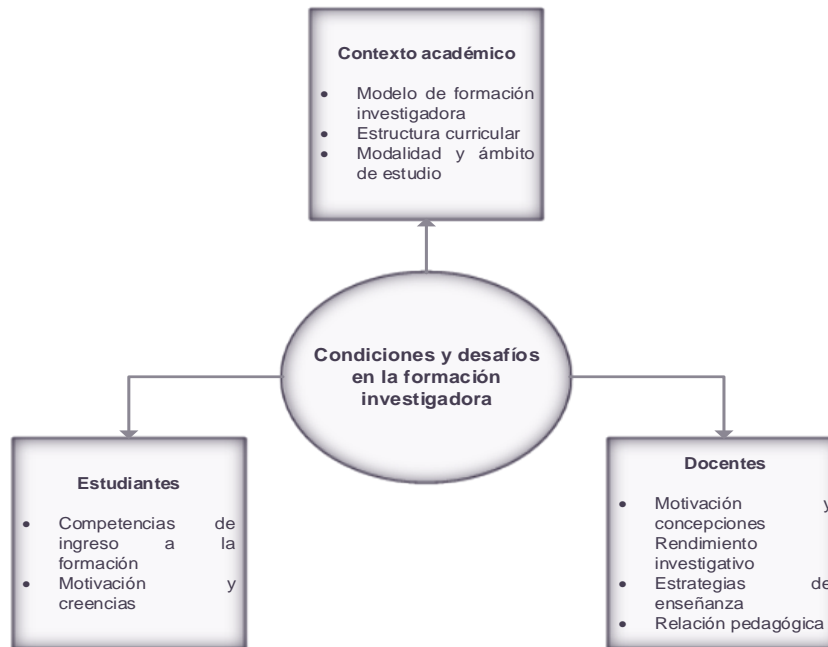
Figura 1. Condiciones y desafío en la formación investigadora de docentes previo al servicio

Haciendo referencia al contexto académico, la literatura señala que para el éxito de la formación en este campo se requiere de un estrecho vínculo entre docencia e investigación (Brew, 2010; Durmuşçelebi, 2018; Medwell y Wray, 2014). Esto permite centrar la enseñanza en el estudiante y generar aprendizaje profundo (González y Otero, 2019). Sin embargo, la tendencia a privilegiar una de estas funciones universitarias va en detrimento de la conformación de esta relación dialógica (Barnett, 2008; González et al., 2016).