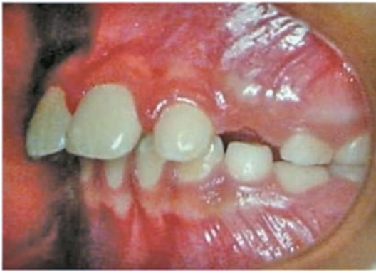
Figura 4. Oclusión izquierda pre intervención.