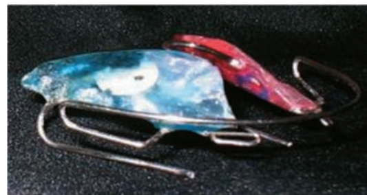
Figura 1. Segmento superior, nótese los arcos dorsales.

En los modelos de yeso y con el registro de cambio de postura mandibular, se confeccionó el reposicionador mandibular S.N.1 a cada uno de los participantes (Figuras 1 a 5). El Simoes Network 1 es un aparato ortopédico funcional bimaxilar que consta de dos placas de acrílico, una es el segmento inferior que incluye dos tubos telescópicos de 0.40' de diámetro interno, donde se insertan dos respectivos arcos dorsales (alambre S.S. 0,36' hard ) provenientes de la placa superior con el objeto de reposicionar anteriormente la mandíbula y no permitir su retroceso. La asociación entre tubos telescópicos y arcos dorsales permite el movimiento protrusivo y lateroprotrusivo mandibular. 35 Una de las recomendaciones de un estudio previo a este con otro tipo de reposicionador, fue la de implementar o diseñar futuros aparatos que además de cambiar la posición mandibular, permitan movimientos mandibulares, para evitar el cansancio muscular. 36