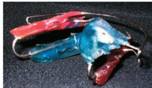
Figura 3. Aparato ensamblado.