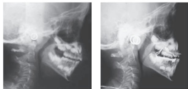
Figura 7 y 8. Radiografías de perfil en posición vertical pre y post-intervención. Nótese la ampliación de los espacios faríngeos posterior a la intervención.

vertical fue, en promedio, de 1.6166 mm y esta diferencia tuvo un rango de 0.0 a 5.0 mm (Figuras 3 y 4). En la toma en posición supina la diferencia fue en promedio de 1.6176 mm con un rango entre 0 mm y 4.0 mm. En la toma en posición supina del espacio faríngeo medio, se evidenció un aumento promedio de 1.5 mm (dt = 1.94454) post-intervención con valores de incremento del espacio hasta 6 mm y disminución del mismo hasta un milímetro.