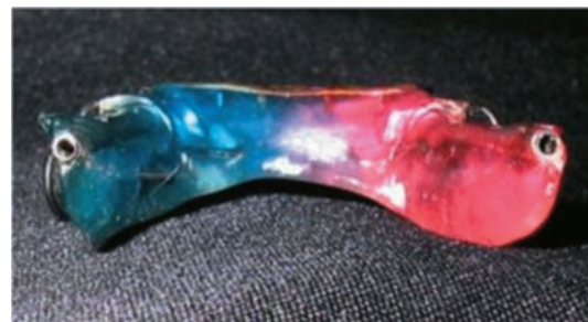
Figura 2. Segmento inferior (vista posterior). Se aprecian los tubos.