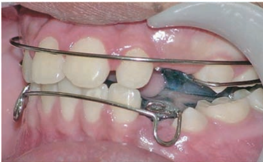
Figura 5. Oclusión izquierda post intervención.

Todos los individuos del grupo 2 (clase I esquelética) eran tratados por una deficiencia transversal (apiñamiento) y una sobremordida vertical aumentada, mediante aparatología ortopédica funcional pistas Planas para clase I. 35-37 A estos aparatos se les realizó una modificación que consistió en insertar tubos telescópicos en la base acrílica inferior y arcos dorsales (S.S. hard calibre 0,40') en la base acrílica superior. Esta modificación se realizó con el objeto de convertir las pistas Planas en S.N.1 modificado, durante la toma de los registros radiográficos.