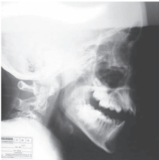
Figura 6. Radiografía de perfil en posición supina dorsal pre-intervención.

El creciente uso de reposicionadores mandibulares para tratar obstrucciones orofaríngeas durante el sueño, hace indispensable determinar su eficacia inmediata y sus efectos posteriores. En el presente estudio, el S.N.1 fue efectivo en la ampliación de la orofaringe en ambos grupos experimentales. Estudios a corto y a largo plazo han demostrado la efectividad de los reposicionadores mandibulares en la ampliación de los espacios faríngeos en adultos. 25-34,55 Lowe, realizó un estudio comparativo entre 13 distintas aparatologías; las medidas lineales cefalométricas demostraron incrementos de alrededor del 100% en los tres espacios faríngeos utilizando el aparato de Herbst. Concluye que el Jasper Jumper no es capaz de contrarrestar la fuerza gravitacional de la mandíbula en posición supina, ni siquiera adicionando elásticos verticales. 31 En otro estudio, el mismo autor reconstruye en tres dimensiones la vía aérea mediante escanografía, antes y después de la inserción de un reposicionador mandibular, observó una elongación anteroposterior de la totalidad del tubo respiratorio después de la intervención. 55