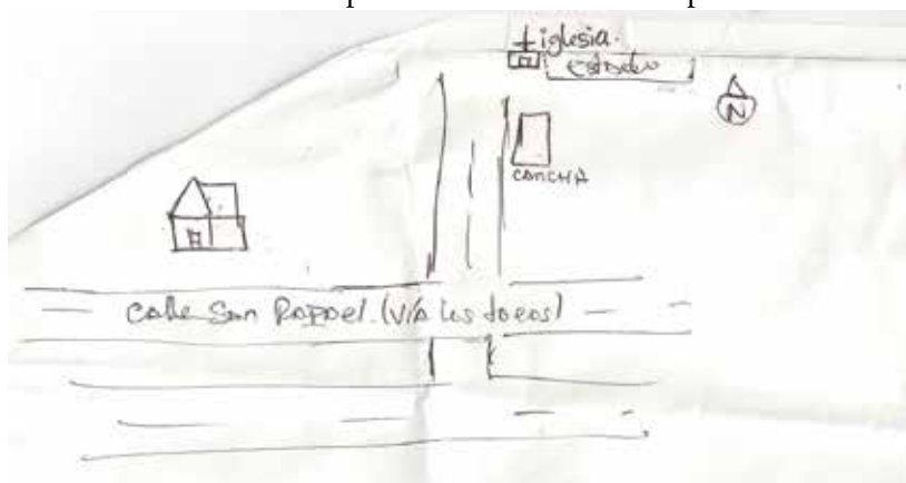
Gráfico 2: Representación cognitiva del espacio del Sr Nicolás Reyes.

Cuando se alude al discurso de los “consejeros”, no es exclusivamente oral, mediante la palabra, sino también desde las representaciones mentales de su espacio a través de la cartografía cognitiva 3 . La noción de espacio se conforma por tres propiedades básicas: identidad, o grado de distinción de un elemento con respecto al resto; estructura, o relación espacial o pautal de un objeto con el observador, y con los otros objetos; y significado, o valor emotivo o práctico de un elemento (un elemento puede contener en sí un significado mítico, social, económico, político, ancestral y patrimonial, o puede contener una significación utilitaria) (Villasante, citado por Carrero, 2005). La cotidianidad es contada a través de las rutas y caminos que los “consejeros” siguen a en su diario vivir, dándole sentido a cada pisada que ponen en su terruño. Varios pobladores describen su espacio: