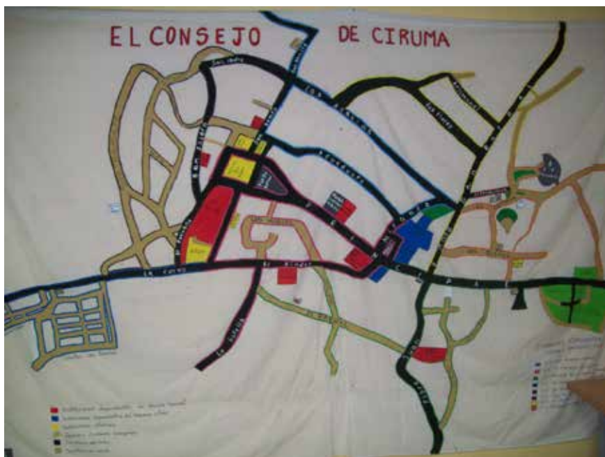
Gráfico1: Plano de El Consejo de Ciruma elaborado por el personal del Infocentro local

Entre las características geográficas del espacio, tenemos; el Parque el Cardón, que consta de una selva tropical húmeda con una temperatura de 35 a 40°C. Fue reinaugurado el 06 de julio del año 2013 bajo el nombre “Parque Ecoturístico El Cardón”. Presenta unos árboles entre ellos uno de 18 metros de altura llamado “algarrobo” (corobore, para los lugareños) y cabimos (Copaiba).