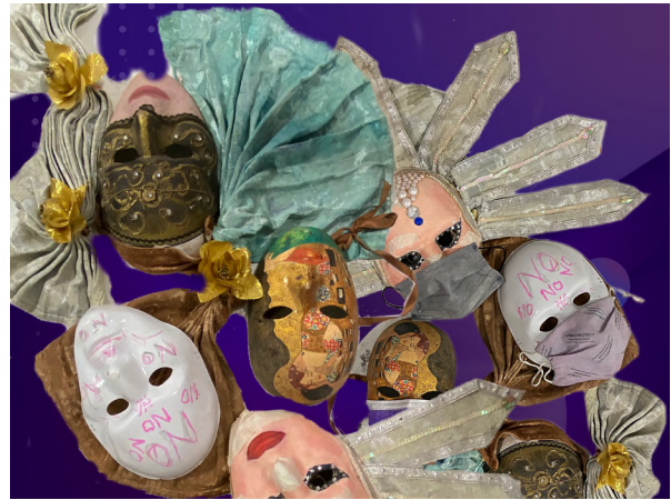
Imagen 7: Borra, Castillo, Cornago, Estarellas, Siragusa y Zlauvinen (2022). Tiempos de pandemia y después de la extinción [collage digital].

Voz: Es verdad, hay que recuperar el movimiento de caderas y olvidarnos del coco. La extinción vino por un desajuste grave entre las caderas y las cabezas. El sapiens nunca tuvo esto claro. Eso los mató.