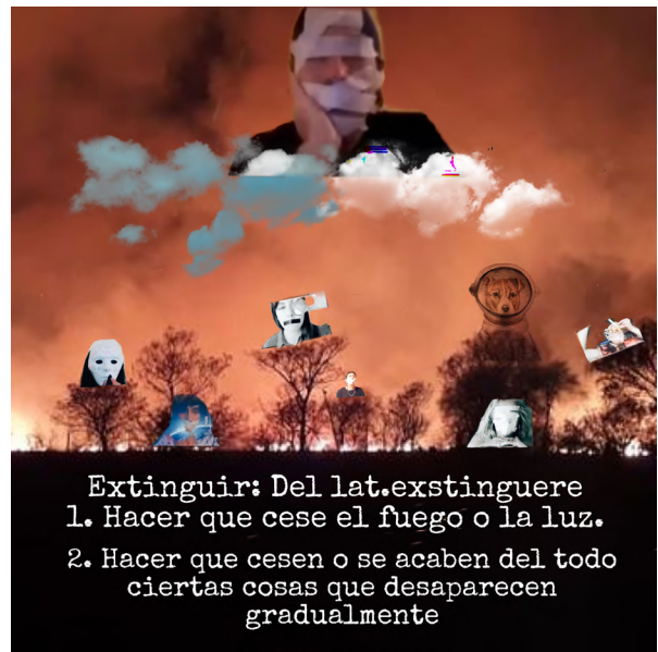
Imagen 1: Castillo, (2021). Extinguir [collage digital]. Colaboradores: Borra, Cornago, Estarellas, Siragusa y Zlauvinen.

Voz [otra]: Como presentación del trabajo, el texto resulta bonito, pero no creo que seamos todas fantasmas. Vamos a ver... bueno, me presento primero, me llamo... En fin, eso no importa ahora. Hace seis meses me diagnosticaron una enfermedad que me cambió la vida. Qué enfermedad es, tampoco importa, una de esas que te