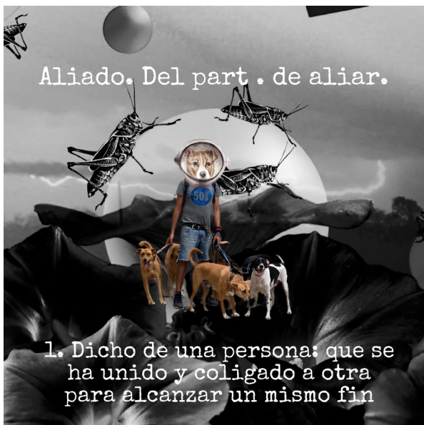
Imagen 3: Castillo (2021). Aliado [collage digital]. Colaboradores: Borra, Cornago, Estarellas, Siragusa y Zlauvinen.

Voz: Y fue por eso que vinieron los aliados , para ayudarnos. Eso pensábamos.