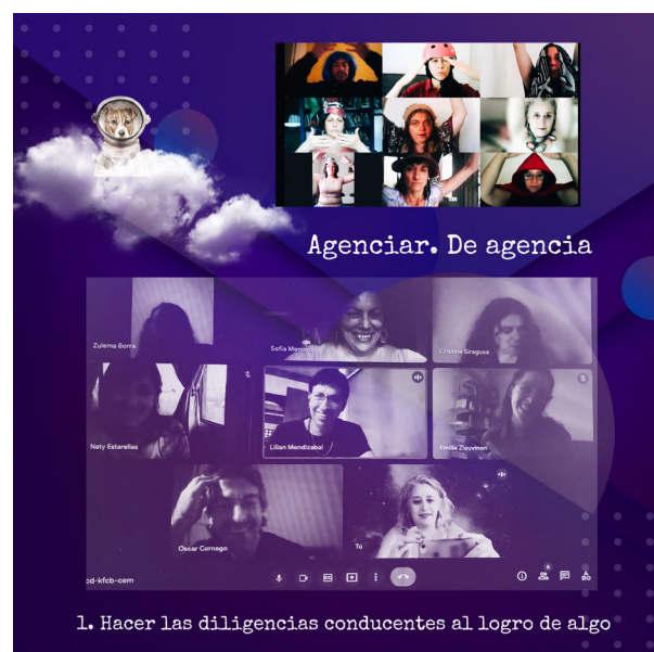
Imagen 2: Castillo (2021). Agenciar [collage digital]. Colaboradores: Borra, Cornago, Estarellas, Siragusa y Zlauvinen.

Voz: Las agencias de investigación . Fue así como empezó todo, con aquellos pequeños ejercicios de escucha del espacio y de nosotras mismas a través del espacio. ¿Recordáis? Escuchar y escucharnos.