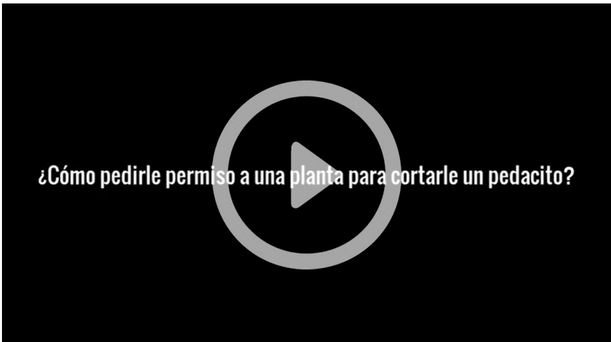
Video 1: Castillo, Menoyo y Zlauvinen (2021). De abuelas, madres e hijas [fragmento]. Regalo ofrecido por el Grupo 5 en el marco del Curso “Mi perra Lulú en Córdoba”. Click en la imagen para reproducir.

es mía. La he tomado de una novela francesa titulada Delante de mi madre, Devant ma mère en el original.