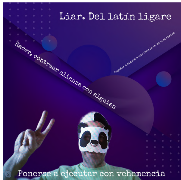
Imagen 4: Castillo (2021). Liar [collage digital]. Colaboradores: Borra, Cornago, Estarellas, Siragusa y Zlauvinen.

Voz: Como los primeros seres sobre la Tierra. Hacían sin saber.