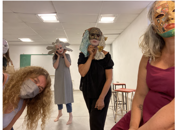
Imagen 6: Borra, Castillo, Cornago, Estarellas, Siragusa y Zlauvinen (2022). Retorno al CePIA, entre máscaras y espectros [performance].

Voz [otra]: Che, estoy harta de rezos. En DDLE no debería haber más rezos. Son aburridos, cansados, repetitivos.