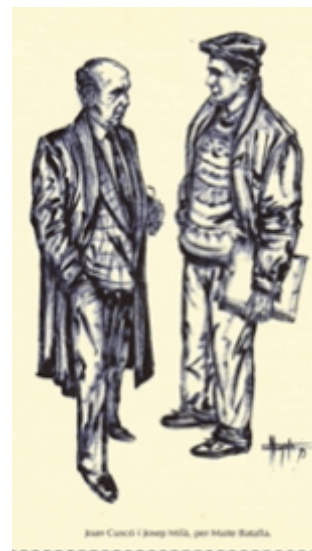
Dibuix de Maite Batalla amb motiu de l'edició del llibre Cartes d'amor i de mar de la col·lecció Quadern .

He llegit i acceptat les condicions establertes en l' avis legal i política de privacitat .