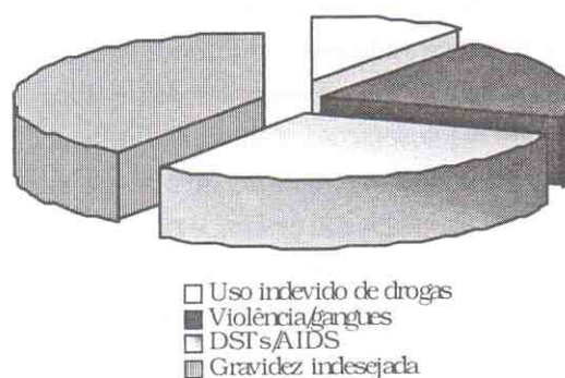
Figura 3 – Percepções das Ameaças/Situações de Riscos Presentes nos Adolescentes deste Estudo

Na percepção dos adolescentes participantes deste estudo, essas situações constituem ameaças à sua integridade bio-psicossocial. Pela figura as DST/AIDS apresentam-se em 3º nível de percepção de risco. Podemos observar, a partir das falas dos adolescentes, que o engajamento dos mesmos, em comportamentos de risco, vem acompanhado de limitadas informações acerca dos problemas que envolvem suas escolhas. A integridade dos jovens, não raro, é ameaçada pelos constantes apelos da exclusão social, baixa auto-estima, diminuta perspectiva de ascensão social e conflito de valores. Mesmo indicando as situações de ameaça, as atitudes de enfrentamento estão ainda veladas pela máscara da extrema pobreza, onde a busca pelo prazer, e o momento da descoberta, constituem o mundo vivenciado por esses adolescentes, conforme ilustram as falas a seguir expressas: