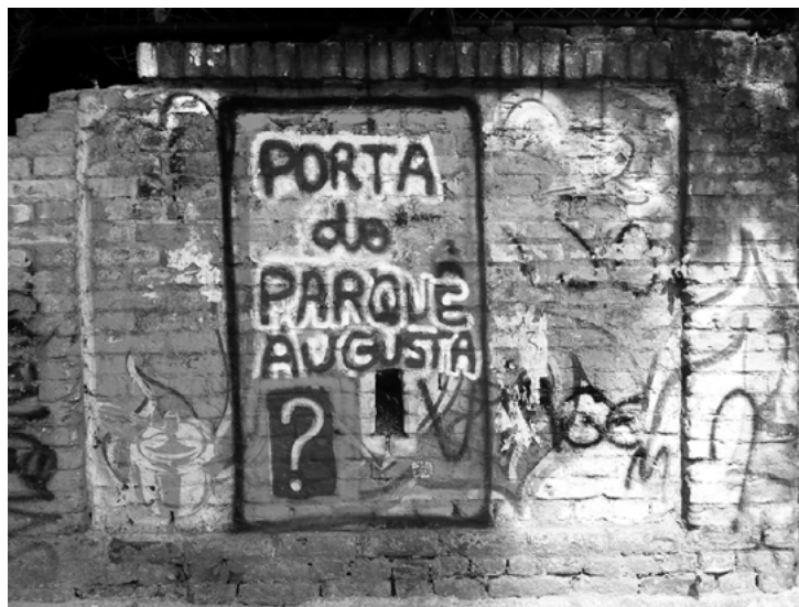
Figura 7. Grafiti protesta en la pared del terreno en disputa

La ley sancionada a partir del proyecto de Ley 345 del 2006—que estuvo tramitando en la cámara municipal desde