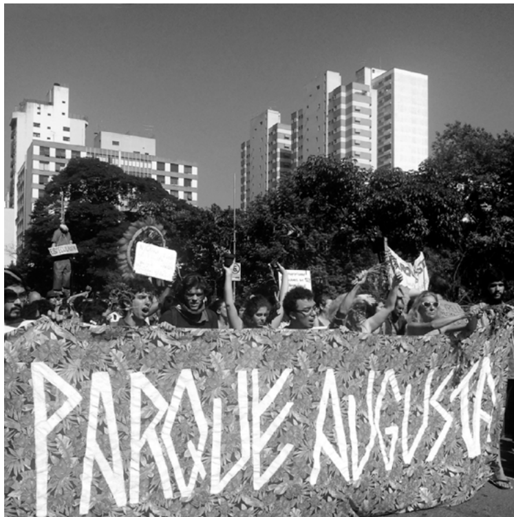
Figura 8. Los manifestantes llevan pancarta pro Parque Augusta