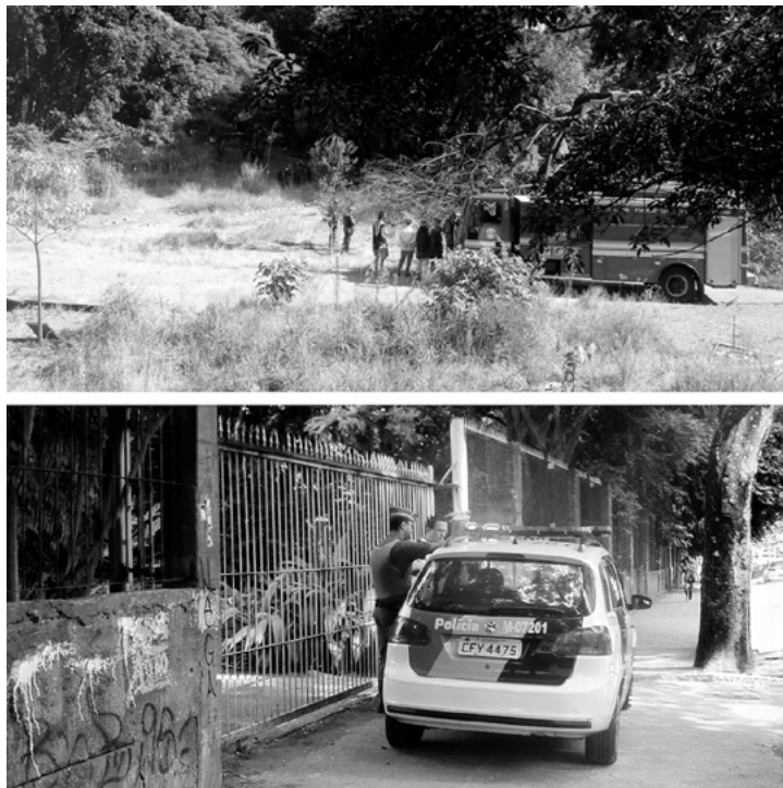
Figura 6. Acción de desalojo del terreno en litigio