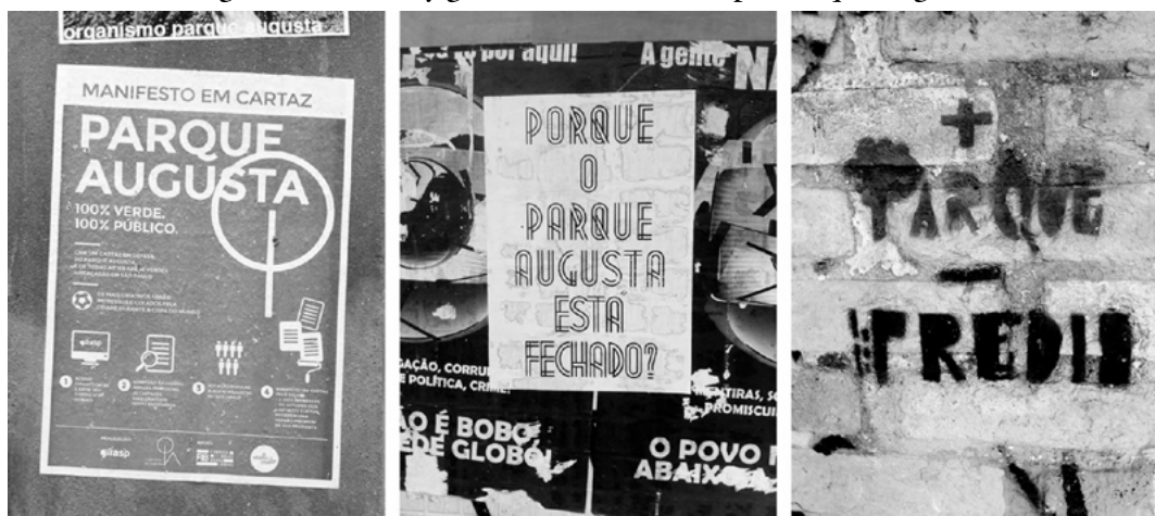
Figura 4. Carteles y grafiti de movimientos pro Parque Augusta

En el 2006, en una acción conjunta con Samorcc, el grupo Aliados do Parque Augusta alcanzó las 15000 firmas y obtuvo el apoyo de los concejales Juscelino Gadelha y Aurélio Nomura, quienes propusieron la creación del parque con el Proyecto de Ley 345 del 2006. Aunque no haya sido sancionada en ese momento,