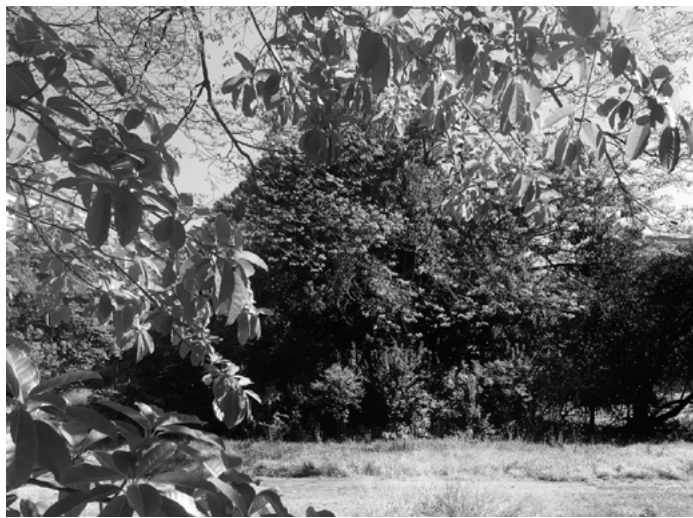
Figura 2. Terreno en disputa para implementación del Parque Augusta