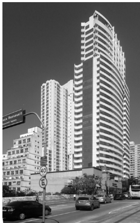
Figura 9. Nuevo Hotel Ca'D'Oro y obras para un nuevo residencial en la rua Augusta, número 75 (enfrente al Hotel)