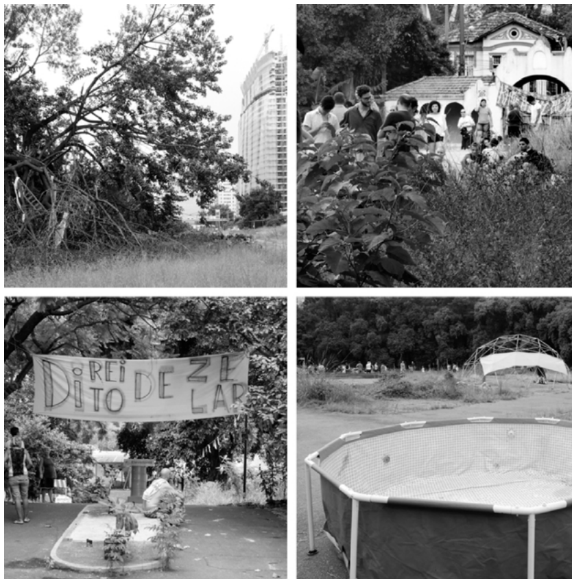
Figura 5. Ocupación Verão Parque Augusta , 18 de enero del 2015