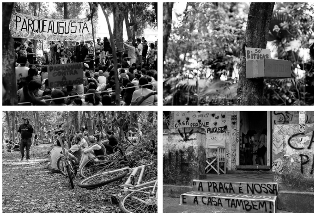
Figura 3. Movilización Parque Augusta, segundo semestre del 2013