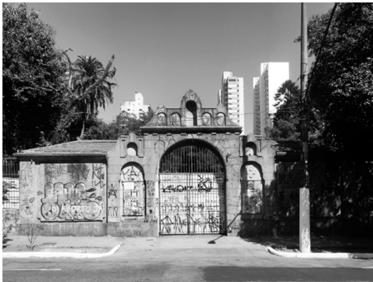
Figura 10. Puerta cerrada del terreno en disputa, situación actual a 5 de mayo del 2020