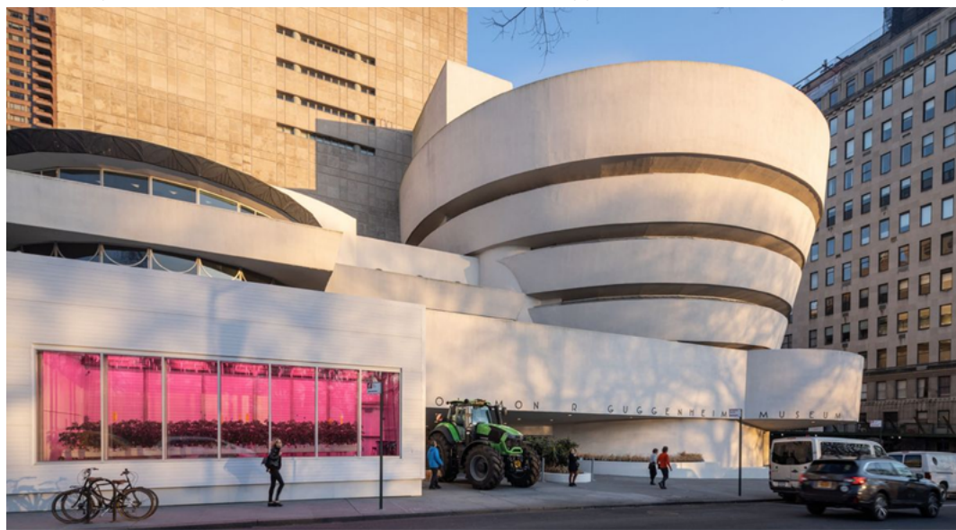
Figura 4. Vista de la instalación en el museo Guggenheim, febrero-agosto 2020