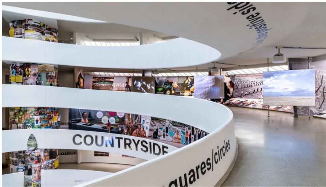
Figura 3. Vista de la instalación en el museo Guggenheim