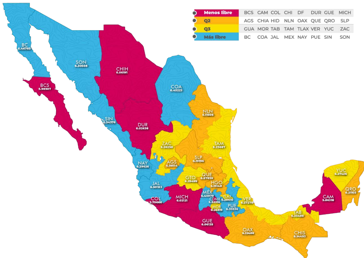
Figura 3. Agrupación de las entidades, nivel de LE 2015, México.

En la Tabla 1 se presenta la matriz de correlaciones entre las variables involucradas. Se observa que entre el LOGLA y LOGLE existe una correlación positiva, pero no estadísticamente significativa, aunado a que el coeficiente es sumamente reducido; dicho número resume bien la información contenida en las series y la tendencia que se observa entre ellas. Destaca que LOGPIBMAN y LOGPIBMAN presentan correlaciones positivas con LOGLA que son estadísticamente significativas. La variable CRISIS tiene el signo esperado de la correlación con LOGLA, pero no es significativo.