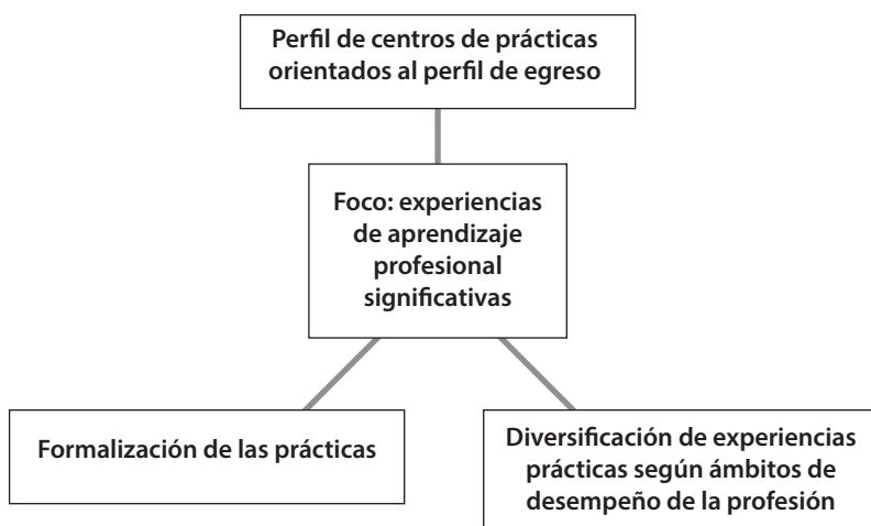
Figura 3. Ejes para la alianza con el medio para la formación profesional

Si bien se plantea para el caso estudiado limitaciones para impulsar un modelo de educación dual o de estrecha vinculación con los actores del medio socio-productivo, al estilo de aulas industriales, se propone como necesario intensificar la relación con los actores e institucionalizarla. Esta alianza debe ser permanente, formalizada entre las instituciones, que visibilice mutuos beneficios. En esta línea, se propone un modelo de alianza con 3 ejes: