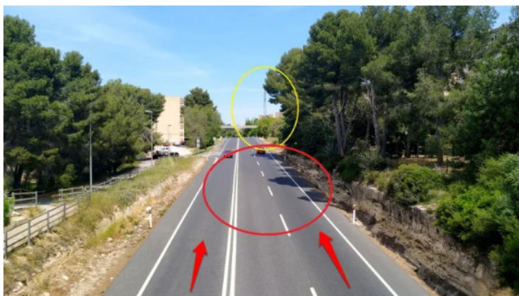
Lugar exacto del accidente 100 años después. En amarillo una torre de la línea de Alta Tensión que sirve como referencia respecto a la imagen anterior. Las líneas rojas indican la dirección de los participantes.

El lugar exacto del accidente se sitúa entre los kilómetros 4 y 6 del circuito. En la hoy Barriada de San Salvador de Tarragona. En 1922 no había casas, y era el sitio del trazado más cercano al pueblo de Constantí desde donde se podían divisar hasta casi 5 kilómetros del trazado (desde la subida de la Pedrera hasta el puente del Codony) por situarse ese sitio exacto en un pequeño alto de la carretera. Por lo tanto, el sitio estaba lleno de habitantes de ese pueblo (entre 400 y 500) y por desgracia así se reflejó en el número de víctimas.