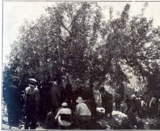
Atendiendo a los heridos ( Catalunya Gràfica )