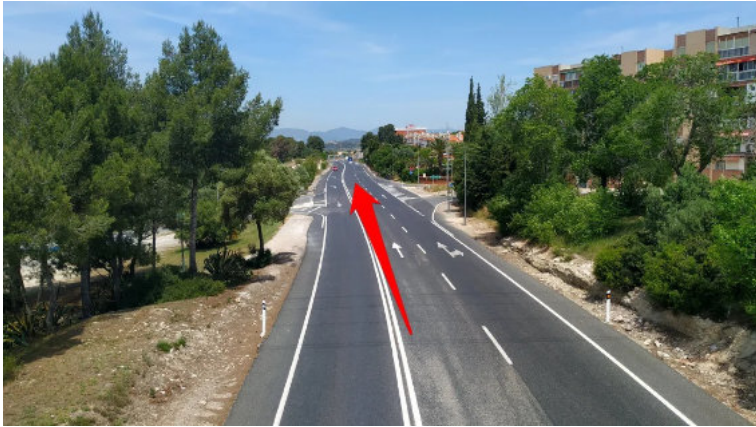
Las vistas desde ese punto hacia el norte. Hace 100 años las vistas alcanzaban hasta el Puente del Codony.