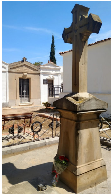
Cinco claveles rojos recuerdan a las cinco víctimas del accidente.