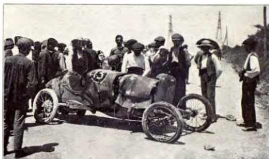
El coche en mitad de la carretera tras el accidente ( Catalunya Gráfica ).

Versión 3: El periodista Tenu, del periódico local El Diluvio , publicó su versión del accidente el día 24 de mayo tras interrogar a todos los presentes que pudo. En ésta, se detalla que a 300 pasos del suceso, mientras Lombard intentaba avanzar al Loryc 2 de Augusto Chasaigne, se le rompió un neumático delantero. Lombard intenta frenar sin éxito, patinándole el coche y yéndose contra el público que no estaba ocupando la carretera, sino que se situaba junto a ella.