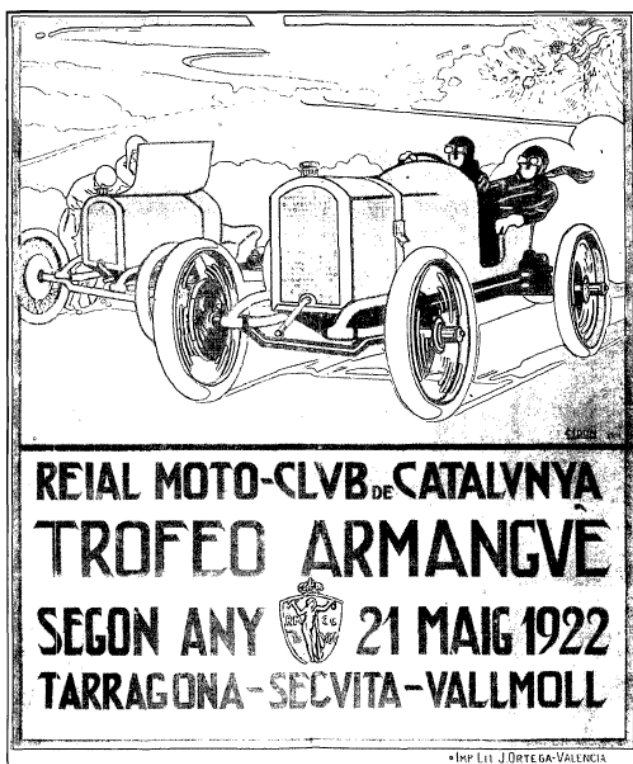
Cartel del Trofeo Armangué (1922)

El hecho de que pocos meses después se volviera a celebrar el II Trofeo Armangué sin incidencias, la poca repercusión que tuvo en medios nacionales (aunque tuvo muchísima en medios locales) y el paso del tiempo; han hecho olvidar a casi todos los amantes del motor y a los propios habitantes de Constantí, un hecho trágico que, con vistas al centenario me he visto en la obligación de volver a recordar, documentándome con todos los archivos de los que he podido (o me han facilitado) disponer.