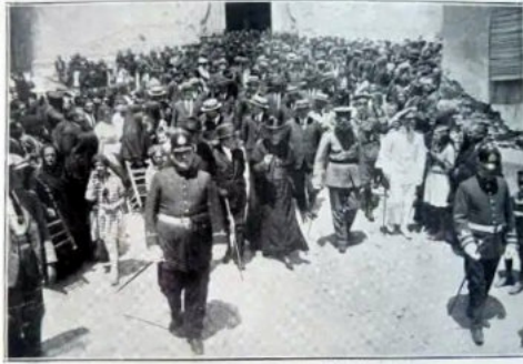
Funeral de Constantí