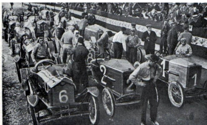
Instantes antes de la salida