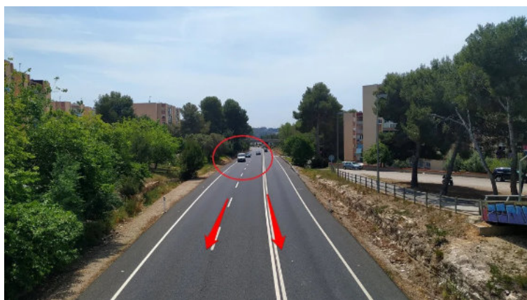
La 'pujada llarga' en la actualidad. Hace 100 años, sin edificios ni pinos, las vistas eran mucho mejores.