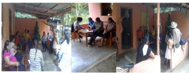
Figura 3. Reunión y aplicación de cuestionarios a productores de frutas, de la localidad Mina y Matamoros (San Pablo Tamborel), municipio de Teapa, Tabasco.