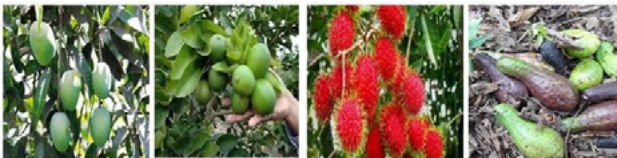
Figura 9. Variedad de frutas encontradas durante el trabajo de campo en las parcelas, huertos familiares y traspatios, de la localidad Mina y Matamoros (San Pablo Tamborel), municipio de Teapa, Tabasco.

Fuente: Autoría del grupo de investigación, imágenes tomadas durante el trabajo de campo.