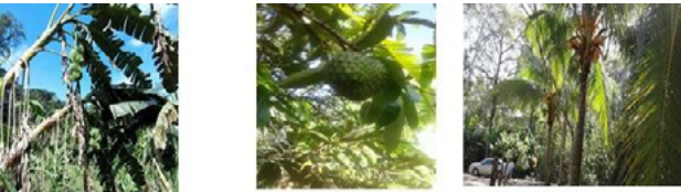
Figura 8. Variedad de frutas encontradas durante el trabajo de campo en las parcelas, huertos familiares y traspatios, de la localidad Mina y Matamoros (San Pablo Tamborel), municipio de Teapa, Tabasco.