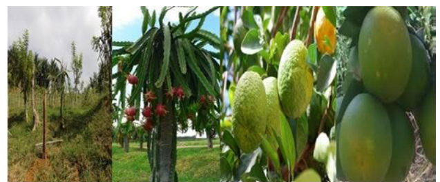
Figura 6. Variedad de frutas encontradas durante el trabajo de campo en las parcelas, huertos familiares y traspatios, de la localidad Mina y Matamoros (San Pablo Tamborel), municipio de Teapa, Tabasco.