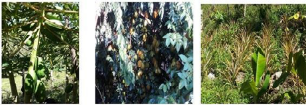
Figura 7. Variedad de frutas encontradas durante el trabajo de campo en las parcelas, huertos familiares y traspatios, de la localidad Mina y Matamoros (San Pablo Tamborel), municipio de Teapa, Tabasco.