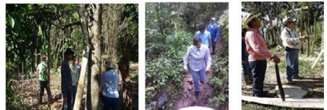
Figura 5. Trabajo de campo realizado por el grupo de investigación en las parcelas, huertos familiares y traspatios, de la localidad Mina y Matamoros (San Pablo Tamborel), municipio de Teapa, Tabasco.