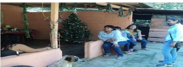
Figura 1. Reunión con la delegada municipal de la localidad Mina y Matamoros (San Pablo Tamborel), municipio de Teapa, Tabasco.