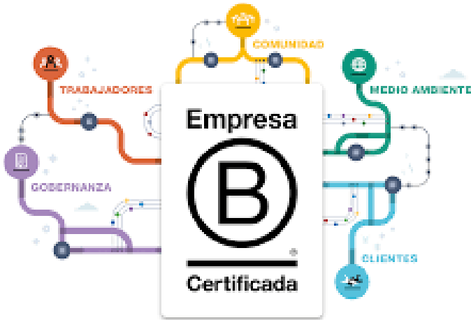
Figura II: Certificación de la empresa B

Es evidente entonces, que las empresas B proponen soluciones a problemas sociales o ambientales, tales como el acceso a una educación de calidad, el consumo consciente y la reducción de residuos, la obesidad y la reincidencia carcelaria, el acceso al crédito, al agua potable, a la energía y a los alimentos de calidad. También, el empleo significativo, la regeneración de los ecosistemas y la valoración de la biodiversidad, así como sin olvidar el turismo consciente y responsable. Las empresas B crean valor no sólo para sus inversores, sino también para sus trabajadores, la comunidad y el medio ambiente.