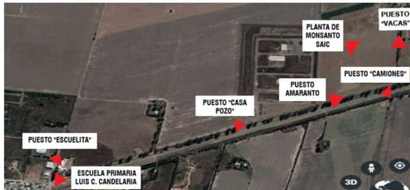
Figura 1. Mapa de los distintos puestos del bloqueo permanente al predio de Monsanto durante el primer trimestre del conflicto.