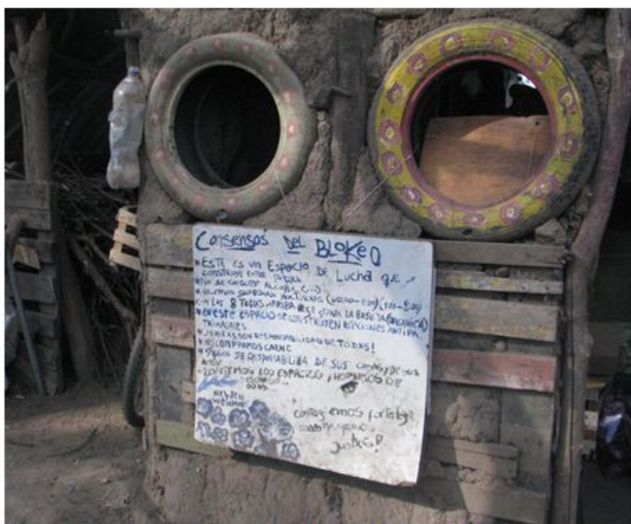
Figura 2. Encuentro de luchas, realizado en el bloqueo a Monsanto al cumplirse dos años de la acción directa.