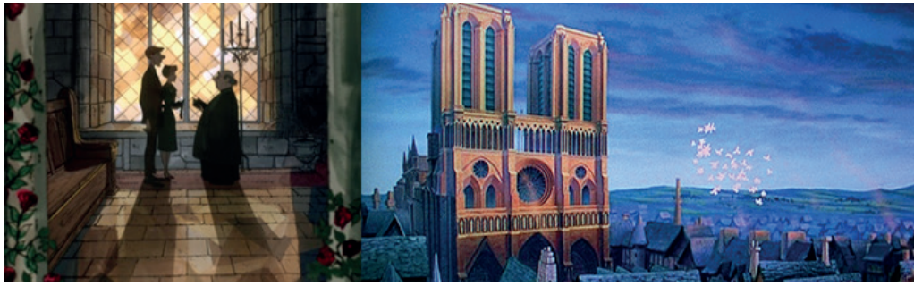
Figura 8. Iglesias en Disney. Fuente: En (de izquierda a derecha) One Hundred and One Dalmatians (101 dálmatas, Disney, 1961) y The Hunchback of Notre Dame (El jorobado de Notre Dame, Hahn, 1996)