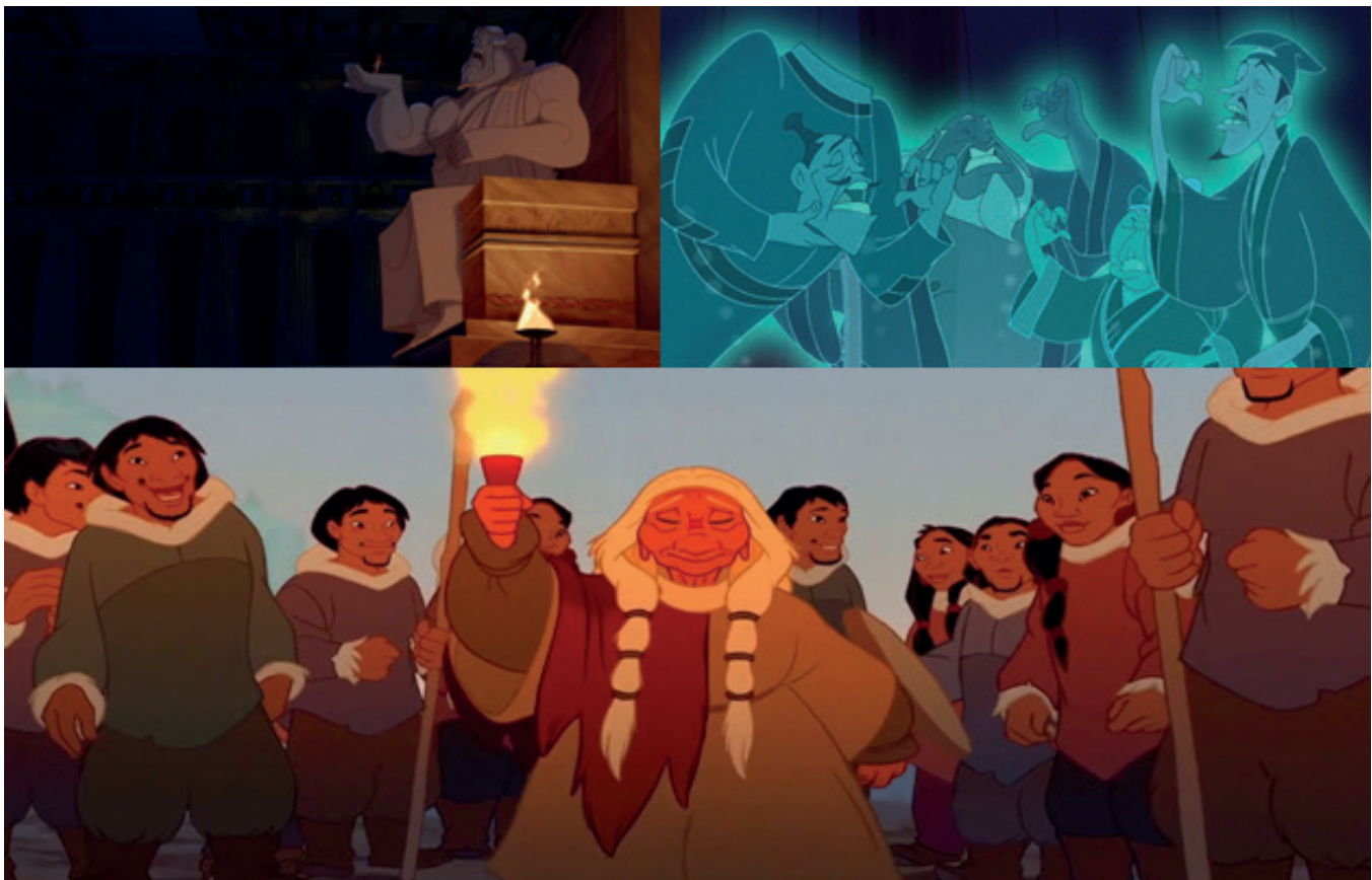
Figura 5. Rituales religiosos diversos. Fuente: En (de izquierda a derecha y de arriba a abajo) Hercules ( Hércules , Clements, Conli y Musker, 1997), Mulan ( Mulan , Coats, 1998) y Brother Bear ( Hermano oso , Williams, 2003)

En relación a las imágenes correspondidas con el dogma cristiano, una mayoría de estas se relacionan con la idea de ascensión al mundo de los cielos. Así se aprecia cuando creen muerta a la pata Sonia y su alma emerge y asciende del cuerpo del animal en el corto “Pedro y el lobo” de Make Mine Music ( Música, maestro , Disney, 1946). Situación similar ocurre con el corto “El ballenato que quiso cantar ópera” del mismo filme cuando la ballena macho es asesi-