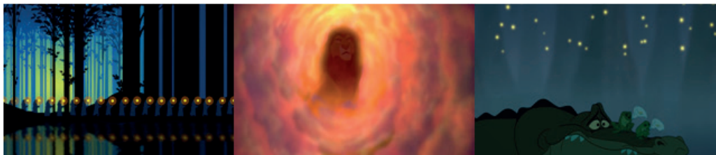
Figura 7. Rituales cristianos (entierro y ascensión al cielo). Fuente: En (de izquierda a derecha) Fantasia ( Fantasia , Disney, 1940), The lion king ( El rey león , Hahn, 1994) y The Princess and the Frog ( Tiana y el sapo , del Vecho y Lasseter, 2009)

nada por los cazadores furtivos. También con Juanito del corto “La leyenda de Juanito manzanas” en Melody Time ( Tiempo de melodía , Disney, 1948). En Sleeping Beauty ( La bella durmiente , Disney, 1959) cuando Aurora cae dormida tras pincharse con un huso de la rueca es depositada en la torre más alta del castillo, para aproximarla así con el reino cristiano de los cielos. También cuando al final del largometraje baila con su príncipe. Con The lion king ( El rey león , Hahn, 1994) Musafa se le aparece a Simba en el cielo tras este morir.