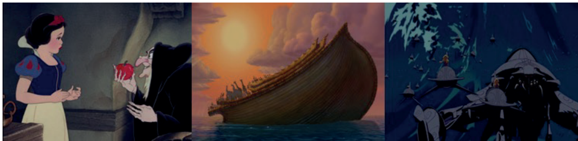
Figura 9. Pasajes bíblicos en Disney. Fuente: En (de izquierda a derecha) Snow White and the Seven Dwarfs (Blancanieves y los siete enanitos, Disney, 1937), Fantasia 2000 (Fantasía 2000, Disney y Ernst, 2000) y Atlantis: The Lost Empire (Atlantis: El imperio perdido, Hahn, 2001)

Con todo, se centra la atención en ciertos elementos iconográficos de la religión cristiana. Por ejemplo, la escultura del Cristo Redentor de Brasil en el corto “Aquarela do Brasil” de The three caballeros (Los tres caballeros, Disney, 1944), en el infierno cristiano del corto “Una noche en el Monte Pelado” de Fantasia (Fantasía, Disney, 1940), en las riquezas de la iglesia custodiadas por el fraile Tuck en Robin Hood (Robin Hood, Reitherman, 1973) o la Biblia que posee Juanito del corto “La leyenda de Juanito manzanas” en Melody Time (Tiempo de melodía, Disney, 1948).