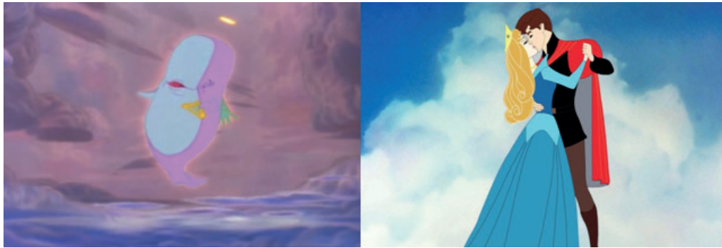
Figura 6. Representación del cielo cristiano en Disney. Fuente: En (de izquierda a derecha) Make Mine Music ( Música, maestro , Disney, 1946) y Sleeping Beauty ( La bella durmiente , Disney, 1959)