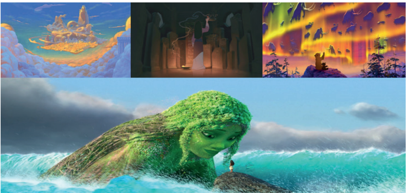
Figura 2. Diversidad religiosa en la colección “Los clásicos” Disney. Fuente: En (de izquierda a derecha y de arriba a abajo) Hércules ( Hércules , Clements, Conli y Musker, 1997), Mulan ( Mulan , Coats, 1998), Brother Bear ( Hermano oso , Williams, 2003) y Moana ( Vaiana , Shurer, 2016)

De hecho, en el propio filme se dirigen a quienes habitan el territorio norteamericano como “paganos”; atendiendo al componente negativo que se le atribuye a dicho concepto por parte de la normatividad (Escribano, 1990). Le sigue el filme Hércules ( Hércules , Clement, Conli y Musker, 1997) en el que se presentan creencias mitológicas y deidades propias de la cultura clásica de la Antigua Grecia. De manera similar ocurre con Mulan ( Mulan , Coats, 1998), película en la que se referencian dogmas ancestrales de la China milenaria. En el largometraje Dinosaur ( Dinosaurio , Marsden, 2000) ubicado cronológicamente en un contexto prehistórico se alude al ateísmo. Otros ejemplos de religiones distantes a la cristiana también se corresponden con tiempos pretéritos a su apogeo con el paso de la Edad Media. Estas materializaciones se muestran con Brother Bear ( Hermano oso , Williams, 2003) en el que la fe se rige por la voluntad de quienes ejecutan el rol de chamanes/as o Moana ( Vaiana , Shurer, 2016) en el que se referencia la cultura de las islas de Indonesia. También se alude al vudú africano en la película The Wild ( Salvaje , Flynn y Goldman, 2006). Con todo, se destaca la ausencia de presentación de otros dogmas actuales como el budismo y/o sintoísmo propios de la cultura oriental y que encuentran una ubicación y tratamiento en todos los filmes japoneses de la compañía Studio Ghibli (Laderman, 2016; Monleón, 2020b; Montero, 2012; López y García, 2019).