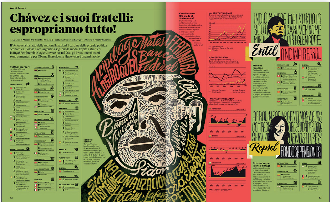
Fig. 1. Visual Il Magazine,2022,Bonetti y Giberi,Behance.

Bonetti y Giberti realizaron de manera colaborativa esta infografía. Las ilustraciones estuvieron a cargo del estudio La Tigre, que se inspiró en murales latinoamericanos de gráfica popular para elaborar el lettering que da la forma a la visual principal de Chávez, haciendo uso de la imagen que se asemeja al personaje para representar icónicamente, diseñada por Giacomini. La dirección de arte de la revista y de elementos infográficos estuvieron a cargo