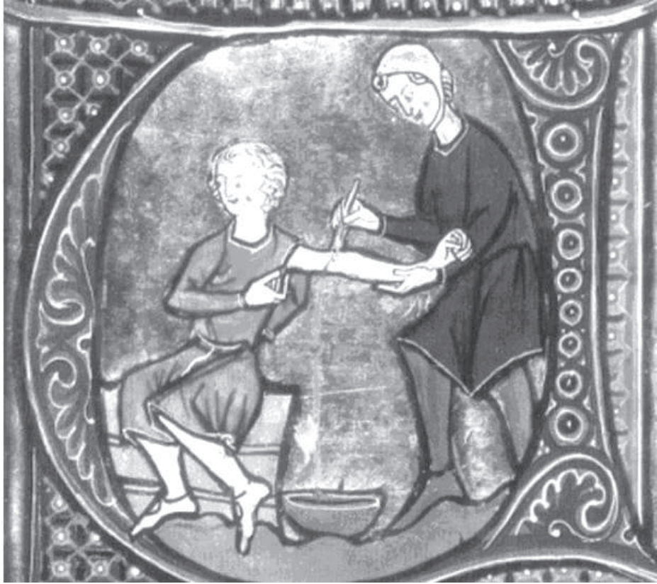
Sangría. Dibujo en una letra capital

Una pragmática de los Reyes Católicos 2 fechada en Segovia el 9 de abril de 1500, LEY VIII: