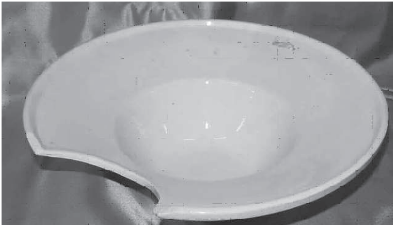
Vacía de barbero

Desde época lejana, los barberos tuvieron su gremio. A diferencia de otras asociaciones gremiales que solían agruparse en espacios determinados de las poblaciones, como los alfareros, caldereros, herreros, joyeros, pañeros, sastres etc., los barberos estaban diseminados entre la población. Formar estas agrupaciones, entre otros contenidos, servía para regular la actividad laboral en defensa de sus intereses, además de controlar también la formación y aprendizaje.