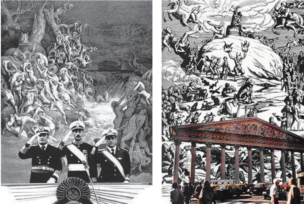
Figura 2 León Ferrari, Serie Nunca más . 1995.

...“ Mientras el arte político es un apoyo a los derechos humanos y una condena a la violación de esos derechos por parte del gobierno que sea, el arte político que apoyó la Iglesia es una violación a los derechos humanos, es un apoyo a los delitos que la Biblia proclama como castigo necesario para los diferentes. No importa si el infierno es real o no, lo que importa es que está en la cabeza de la gente desde hace miles de años. Y es lo que ha provisto, y provee, de justificación para matar gente. Desde las Cruzadas a la dictadura en nuestro país y más recientemente a Bush. En Estados Unidos el 65% de la gente cree en el infierno; esto significa que cree en la tortura del diferente. ¿Por qué no van a torturar iraquíes, si son infieles?” 5 .