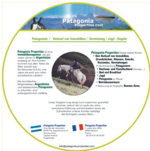
Figura 8. Proyecto Pluja (Córdoba) , 20 impresiones color. 2004.

“Comencé a investigar el monocultivo de la soja transgénica en la Argentina, cuya semilla está patentada por Monsanto, una multinacional que empezó con la industria química, ahora está en la biotecnología y experimenta en países del Tercer Mundo con una soja que es para forraje y no para consumo. A la soja transgénica le han manipulado un gen, una fitohormona, para que sea resistente a un plaguicida que se llama glifosato. Este herbicida mata todo lo que encuentra no sólo en el área específica, sino también en los alrededores. Agota el suelo. Está comprobado que, a través del glifosato, quienes consumen esta soja exclusiva para forraje, sufren de trastorno hormonales serios, sobre todo en la adolescencia” 14 .