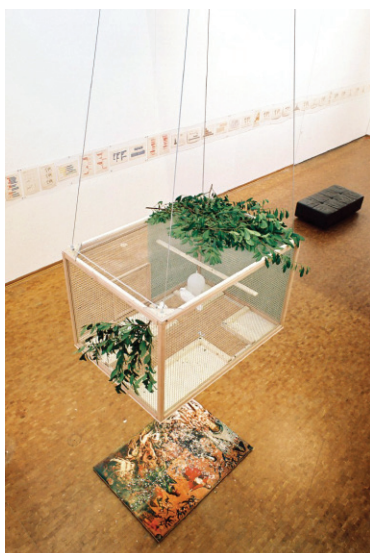
Figura 6. León Ferrari. Instalación de jaula con lámina . 2004.

Con esta obra, Ferrari desnaturaliza el determinismo económico que, a manera de subtexto, sacraliza la globalización neoliberal como un proceso histórico inevitable. Como sabemos, nada hay inevitable en la historia. La historia es contingente, todo podría ser de otra manera.