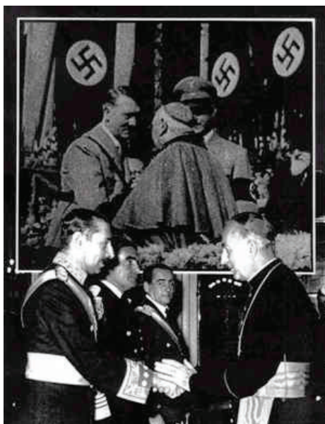
Figura 3. León Ferrari. Serie Nunca más . 1995.

entre otras cosas. No hay una palabra de condena a Hitler por algo que no afecte al catolicismo y su iglesia. Evidencias, pues, más que claras de las relaciones de poder establecidas entre la Iglesia y el poder político 6 .