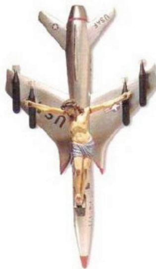
Figura 1. León Ferrari. La civilización occidental y cristiana . 1966. Plástico, óleo y yeso, 200 x 120 x 60 cm. Col. Alicia y León Ferrari.

Una de las imágenes que representan la masacre administrada es La civilización occidental y cristiana 2 , 1966 (Fig. 1), obra por la que León Ferrari (Argentina, 1920) fue elegido como el mejor artista de la 52 Biental Internacional de Arte de Venecia. Se