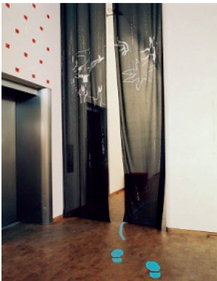
Figura 4. Pórtico, muestra Museo Ludwig, Colonia.