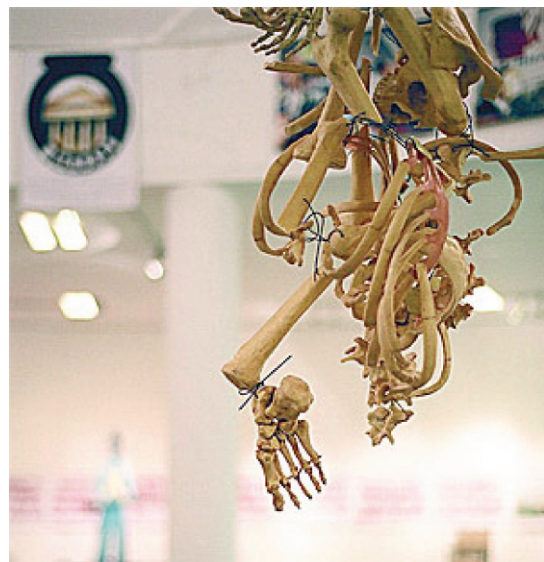
Figura 5. León Ferrari. Objeto hecho de huesos y alambres. Buenos Aires, 2004. Detalle.

La muestra de Colonia se articuló alrededor de cuatro ejes esenciales surgidos durante las primeras etapas de investigación: negación, cartografía, investigación militante y relato político. Son también los que hoy nos ayudan a recorrer el tramo que va desde la crisis hasta la normalidad o desde la muestra de Colonia hasta la de Buenos Aires. La cortina (Fig. 4), que daba inicio a la primera sección, ilustraba la historia de Mr. Invisible Hands, aludiendo a la metáfora creada por Adam Smith para explicar la regulación de las fuerzas del mercado. En esta sección, León Ferrari presentó un esqueleto (Fig. 5) para evidenciar el escándalo de la pobreza que, en la normalidad, ya no produce escándalo. De ese modo, desenmascara el viejo discurso conservador que postula la desigualdad como un hecho natural imposible de erradicar.