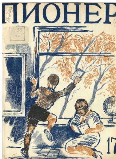
Figura 5. Portada de Pioner

Fuente: Ilustración anónima, portada de Pioner , 17, 1928, sin título, Biblioteca nacional infantil electrónica de Rusia.