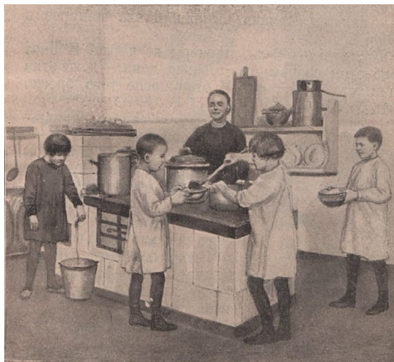
Figura 12. Ilustración de Murzilka

Fuente: Ilustración anónima, Murzilka , 3, 1926, Biblioteca nacional infantil electrónica de Rusia.