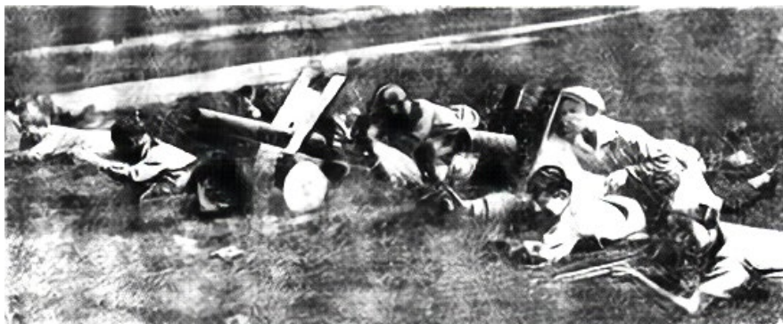
Figura 7. V Boy Vvyazyvayetsya Oruzhiye. Idiom Na Belyj [Las armas están involucradas en la lucha. Vamos a por los blancos]