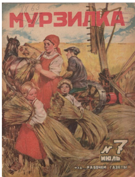
Figura 10. Portada de Murzilka

Fuente: Ilustración anónima, portada de Murzilka , 7, 1929, Sin título, Biblioteca nacional infantil electrónica de Rusia.