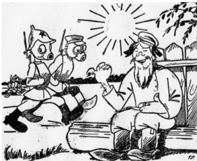
Figura 9. Ilustración de Pionerskaya Pravda

Fuente: Ilustración anónima, Pionerskaya Pravda , 23, 1927, Sin título, Biblioteca nacional infantil electrónica de Rusia.