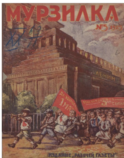
Figura 6. Portada de Murzilka

Fuente: Ilustración anónima, portada de Murzilka , 5, 1925, sin título, Biblioteca nacional infantil electrónica de Rusia.