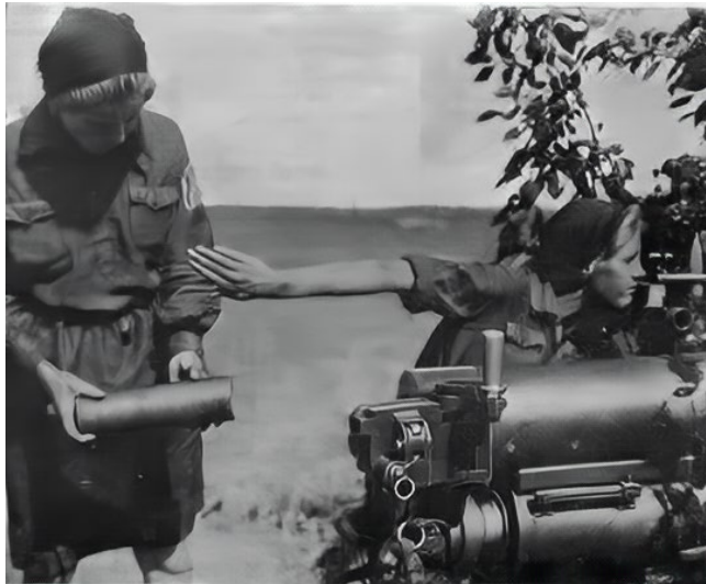
Figura 8. Navodyat Oruzhiye [Apuntar Armas]