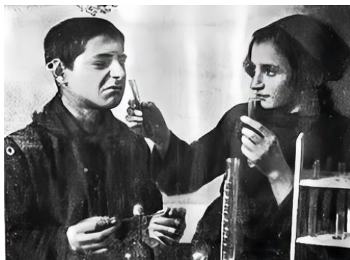
Figura 4. Urok Jimiy [clase de química]