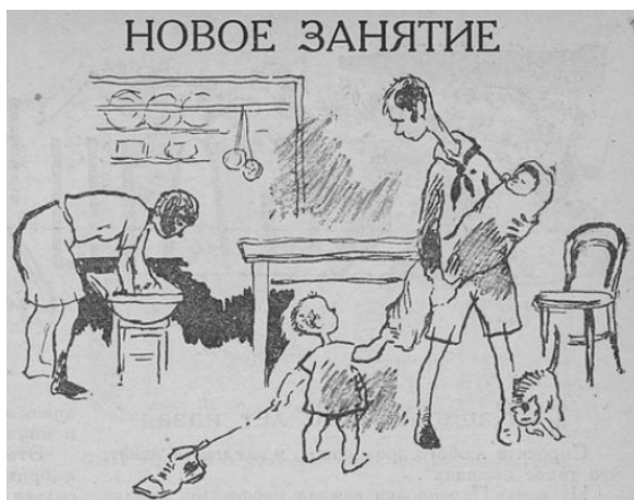
Figura 11. Novoe Zanyatie [Nueva Actividad]