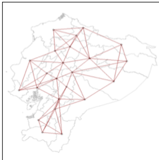
Gráfico 2: Mapa de vecindad entre provincias para Ecuador.

En el gráfico 2, se observa la red de conexión entre provincias y sus vecinos para las 23 provincias del Ecuador continental, la cual fue construida con base a los centroides y a la matriz W bajo el criterio de 4 vecinos más cercanos y utilizando el criterio de exogeneidad, lo cual permitió captar el grado de interdependencia espacial entre las unidades territoriales en estudio y respondiendo al criterio de Regionales o Zonas de Planificación.