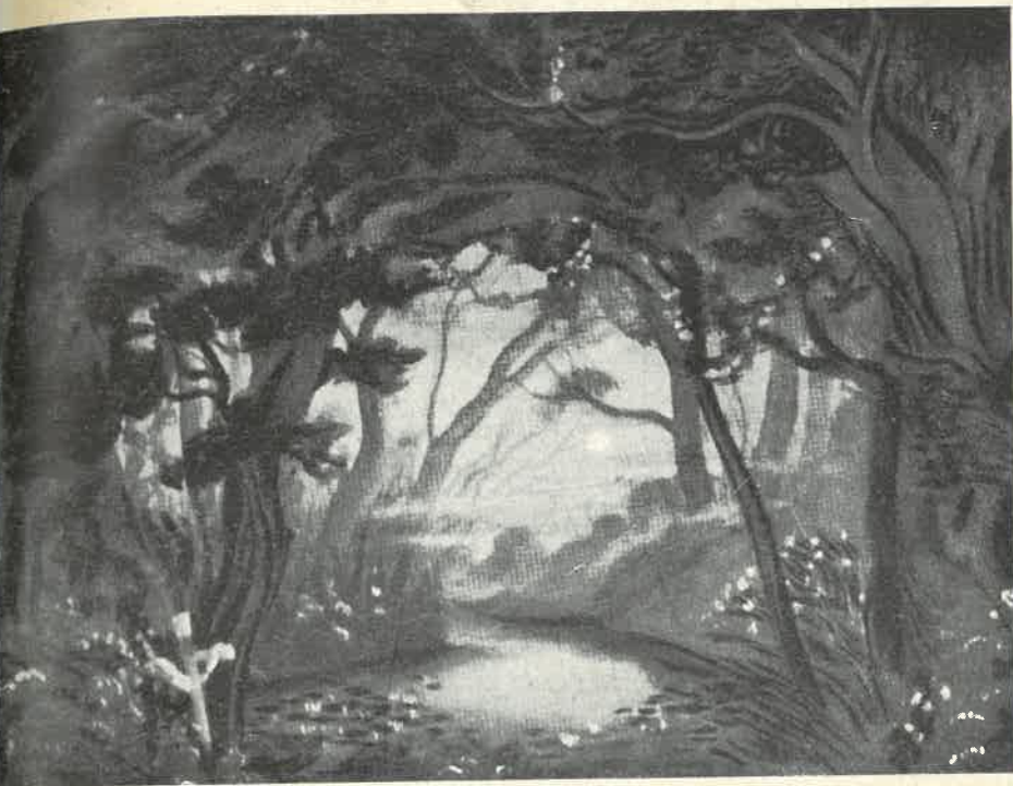
Decoración para «Giselle»